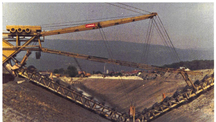
Bild 4. Aushub des Seebodenkanals, Gampelen, Eimerkettenbagger, 1976.