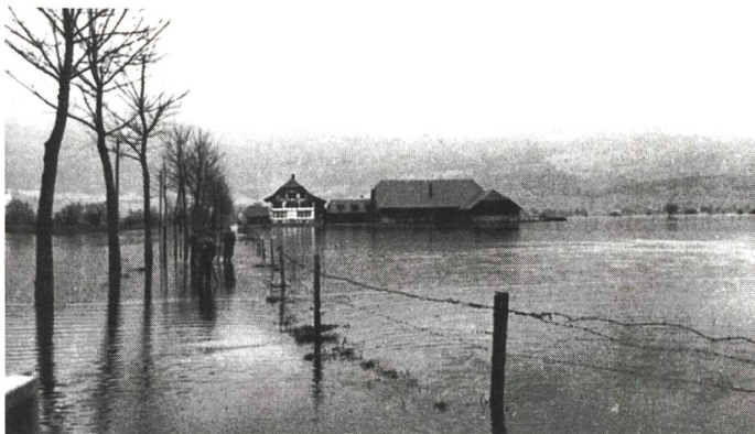
Bild 3. Überschwemmung Januar 1955, Wasserhof, Grissachmoos.

Der Bundesrat beauftragte in den 1980er-Jahren eine Arbeitsgruppe, das geltende «Regulierreglement 1980» auf die Umwelt-