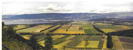
Bild 1. Panorama vom Mont Vully aus: links der Neuenburgersee, rechts der Jolimont, im Hintergrund links der Chaumont und rechts der Chasseral.

Mit der Expo.02 rückte eine schöne, unverwechselbare und interessante Region der Schweiz in den Blickpunkt des Interesses. Die Idee einer Landesausstellung im Grenzgebiet der deutschen und der französischen Sprache in Verbindung mit Wasser, Wasserläufen und Seen ist bestechend. Nebst den kulturellen Aspekten ist die Kulturtechnik in dieser Umgebung nicht minder interessant. Sie ist ein eindrückliches Beispiel für die Thematik der Arbeiten der Fachleute der SIA-Berufsgruppe Boden/Wasser/Luft und soll an dieser Stelle näher betrachtet werden. Wer die Weite der Landesausstellung, des Seelandes und damit der Juragewässer-Korrektion in sein Bewusstsein eindringen lassen möchte, dem sei ein Aufstieg auf den Mont Vully empfohlen, der höchsten Erhebung im Zentrum von Bieler-, Murten- und Neuenburgersee (Bild 1).