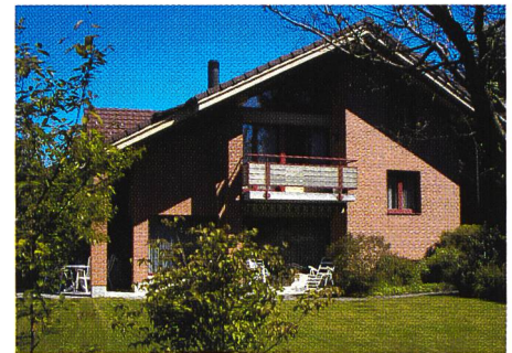
Bild 1. Versuchsobjekt zum Testen der drei Regelstrategien mit Pulsbreitenmodulation [aus Schlussbericht].

linie (Tageswärmebedarf in Funktion der Aussentemperatur) oder einer Laufzeitkennlinie (Wärmeleistungsbedarf gemäss Energiekennlinie dividiert durch Wärmeleistungsproduktion gemäss der Wärmepumpenkennlinie). Während die thermische Trägheit des Gebäudes bei der Energiekennlinienmethode unberücksichtigt bleibt, wird sie bei der Laufzeitkennlinienmethode teilweise erfasst. Die wesentlich weiter gehende dritte Strategie (modellbasierte prädiktive Regelung) berücksichtigt die thermische Trägheit von Gebäude und Wärmeverteilsystem durch ein mathematisch-physikalisches Modell. Weiter enthält sie eine Vorausschätzung der zu erwartenden Aussentemperatur für die kom-