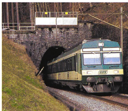
Bild 1. Der Ricken-Bahntunnel verbindet St. Gallen und Rapperswil auf direktem Weg und wird heute auch als Energiequelle genutzt.

Die Realisierung dieses Heizsystems hat zu höheren Wärmegestehungskosten als bei einer konventionellen Gasheizung geführt, da