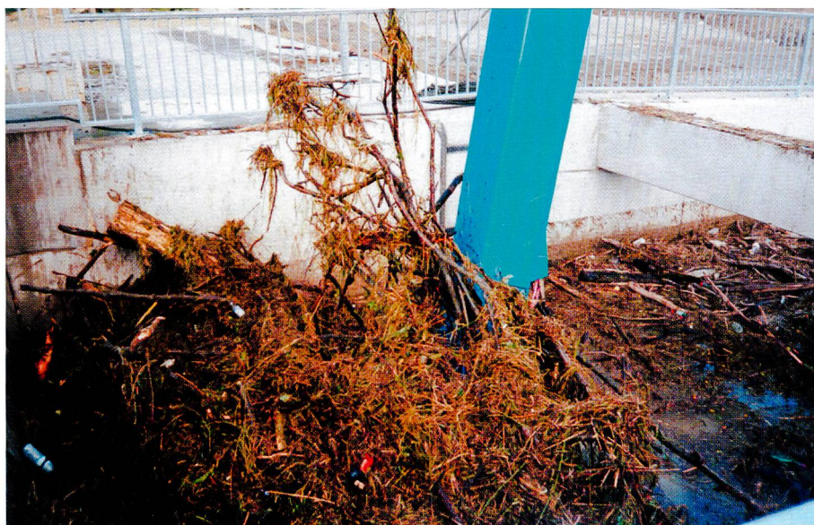
Bild 2. Harke knapp unter der Wasseroberfläche.

Anlage zeigt, dass selbst derart grosse hydraulische Rechenreinigungssysteme bei beengten Platzverhältnissen eingesetzt werden können.