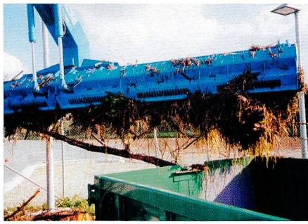
Bild 6. Harke in Abwurfstellung.

Auch die Art des Schwemmgutabwurfes ist in dieser Ausführung einmalig. Da die Greiferharke mit fast 7,5 m um 1 m breiter ist als der Container, ist sie zweiteilig ausgeführt. Der Rechenreiniger dreht sich zuerst so weit, bis die eine Hälfte der Harke mittig über