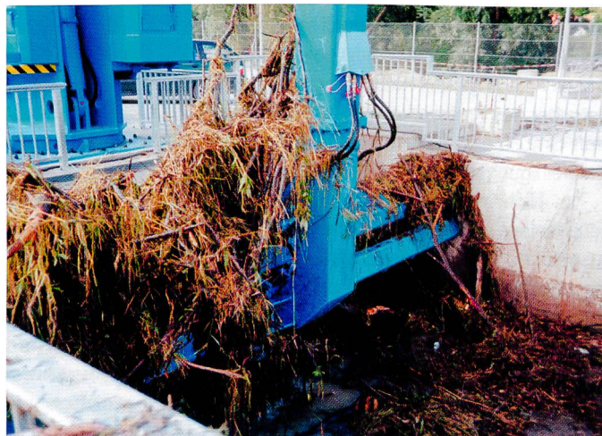
Bild 5. Greiferharke schliesst sich über der Wasseroberfläche.