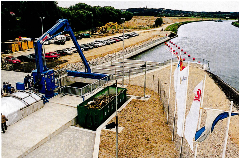
Bild 1. Gesamtansicht Bad Abbach.

Für die Aufstellung der Rechenreinigungsanlage standen weniger als 2,6 m Platz hinter dem Rechen zur Verfügung. Die fertige