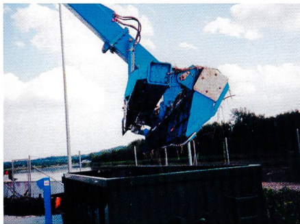
Bild 8. Harke beim Abwurf.

dem Container steht, sich öffnet und das Rechengut in den Container abwirft. Danach dreht sich der Rechenreiniger weiter, bis die andere Hälfte der Harke mittig über dem Container steht und ihr Rechengut abwerfen kann.