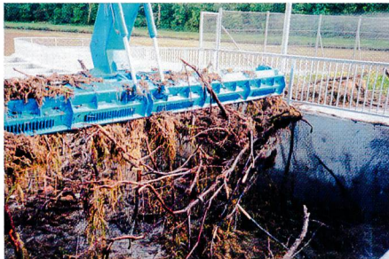
Bild 7. Geschlossene Harke mit Schwemmgut.