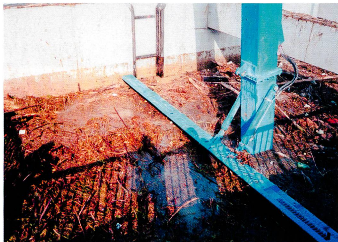
Bild 4. Harke greift vor den Schwemmgutteppich.

Eine Seilrechenreinigungsanlage mit Querförderer hätte dies nie bewältigen können und ein Abstellen der Turbinen wäre unumgänglich gewesen. Mit dem hydraulischen Rechenreiniger aber konnte der Kraftwerks-