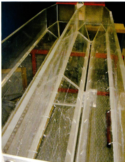
Bild 1. Entsanderanlage mit zwei Becken im Modell: links konventioneller Abzug, rechts Becken mit Sandabzug System HSR.

Bei rein axialem Abfluss nimmt damit die Spülwassermenge zu, wenn die Spülvirbel erhöht werden soll.