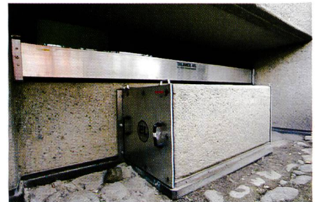
Bild 2. Lichtschacht und Fenster sicher geschützt mit Hochwasser-Schutzsystem Talimex.