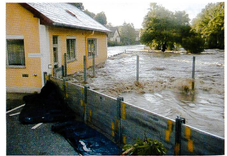
Bild 1. Hochwasser-Schutzsystem Talimex, praxisbewährt.

Höhen und Längen sind individuell lieferbar, aber auch extreme Weiten und Höhen sind erhältlich. Ein weiteres Plus ist, dass sich das Baukastensystem jederzeit ohne grossen Aufwand erweitern lässt. Dies macht Talimex-Hochwassersysteme gerade auch für private Haushalte zur ersten Wahl.