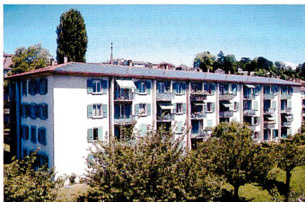
Bild 1. Solarstrom-Contracting: Anlage mit 38 kW Leistung in Lausanne

Ernst Schweizer AG, Metallbau, CH-8908 Hedingen, Telefon 01 763 61 11, Fax 01 763 61 19, info@schweizer-metallbau.ch, www.schweizer-metallbau.ch