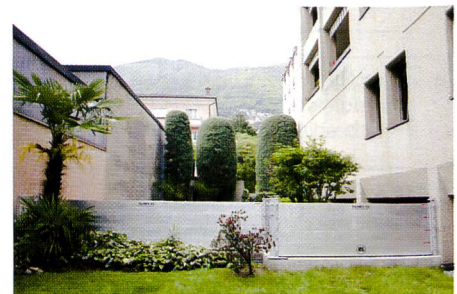
Bild 3. Talimex-Hochwasserschutz passt, individuell angepasst, in jede Liegenschaft.