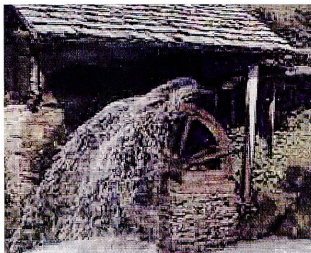
Bild 1. Oberschlächtiges Mühlrad; die mechanische Nutzung der Wasserkraft war landschaftsprägend.

Die Wasserrahmenrichtlinie der Europäischen Union schafft nun für die Wasserkraft ein rechtlich völlig neues Umfeld. Der Gewässerschutz kommt dabei viel stärker zum Tragen, wobei vor allem die Tatsache, dass ein wesentliches Kriterium für die Erreichung eines guten Zustandes auch in der Flussmorphologie und in den angrenzenden Uferzonen liegt, verstärkt zur Geltung kommt. Damit wird die Wasserkraftnutzung trotz bisher geleisteter Umweltanpassungen massiv gefordert.