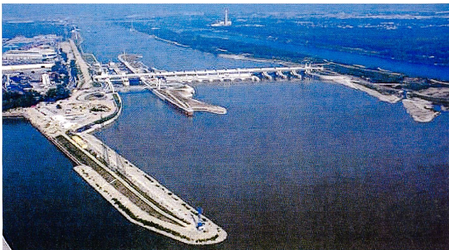
Bild 2. Donaukraftwerk Freudenua; ein Kraftwerk im grossstädtischen Bereich.

Erstmals ist die EU darauf bedacht, dass bei der Umsetzung der Richtlinie innerhalb der Gemeinschaft ein kohärentes Vorgehen gewährleistet ist. Dieses Vorgehen resultiert einerseits aus den bisher gemachten Erfahrungen in Europa, wo Richtlinien sehr unterschiedlich interpretiert werden, und andererseits aus der Tatsache, dass die Rahmenrichtlinie über die Landesgrenzen hinweg flussgebietsbezogen ist. Damit wird eine «Interkalibrierung» zwischen einzelnen Ländern notwendig. Weiters soll die Erreichung der Ziele der Richtlinie gewährleistet sein, wobei Kriterien für die Beurteilung des Gewässerzustandes sowie die Festlegung gemeinsamer Begriffsbestimmungen zur Be-