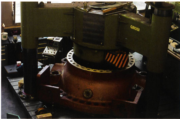
Bild 8. Ausdrehen des Schiebergehäuses.