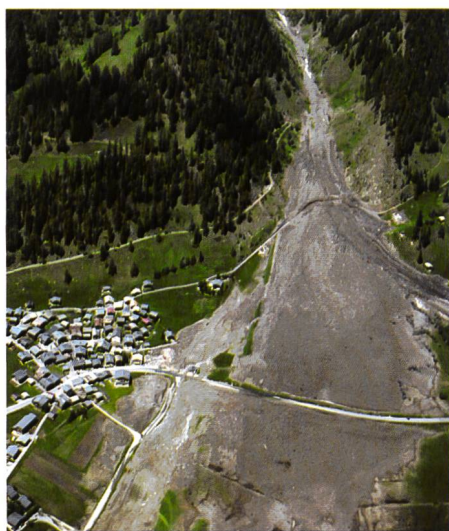
Bild 5. Die Luftaufnahme zeigt Geschinen im Goms VS. Ein riesiger Schuttkegel – die Reste einer Lawine, die das Dorf streifte – prägt auch im darauffolgenden Sommer noch das Landschaftsbild.

Der Lawinenwinter 1999 hat Spuren hinterlassen und verschiedene Fragen aufgeworfen. In der Region Goms hat man bereits verschiedene Lehren gezogen, um auf neue Lawinensituationen entsprechend zu reagieren. In Blützingen, Biel-Selkingen und in Geschinen wurden Lawinenschutzdämme gebaut. Um die Strom- und Telekommunikationsversorgung wintersicherer auszubauen, verlegte