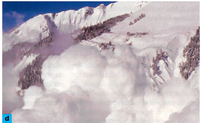
Bilder 1 a–d. Am 25. Februar 1999 wurde im Vallée de la Sionne (ob Sion) vom Eidg. Institut für Lawinenforschung eine Staublawine durch Sprengung ausgelöst. Von einem Bunker aus wurde mit einem Radar die Geschwindigkeit der Lawine gemessen. Dieser Bunker war anschliessend mit 5 m betonhartem Lawinenschnee überdeckt. Der Zeitraum der Bildserie erstreckt sich über etwa eine halbe Minute. Die Staubwolke erhebt sich bis 400 m über die Lawine.