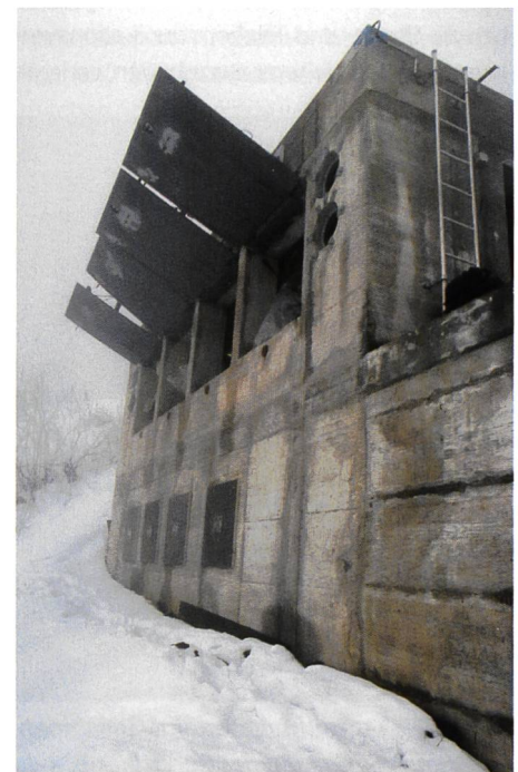
Bild 2. Aussenansicht des Bunkers, wo die Lawinenmessungen gemacht werden. Die Luken werden jeweils vor dem Eintreffen der Lawine geschlossen.

Wenn im Frühling der Schnee durch die Sonne stark erwärmt wird, entstehen die Nassschneelawinen. Sie fliessen viel langsamer.