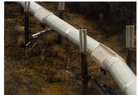
Bild 1. Gleitverschiebungen der Trans-Alaska-Pipeline im Bereich der Denali-Verwerfung (2002 Denali-Erdbeben) (links) und Auflagerschäden der Pipeline infolge Bodenbewegungen.