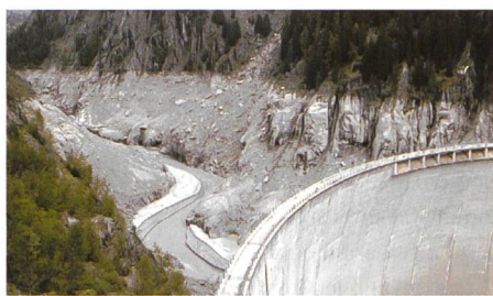
Bild 2. Entleerter Stausee Gibidum.

14, 5 cm) umfassen neben dem Text auch Bild- und Kartenmaterial, eine Literaturliste sowie alle weiteren nötigen Informationen zur Exkursion.