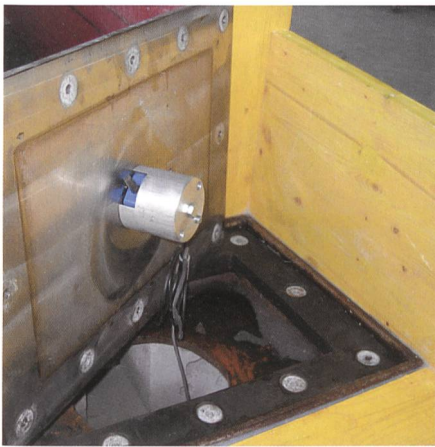
Bild 3a. Aufnahme des Geophonsensors, montiert unter einer Stahlplatte.