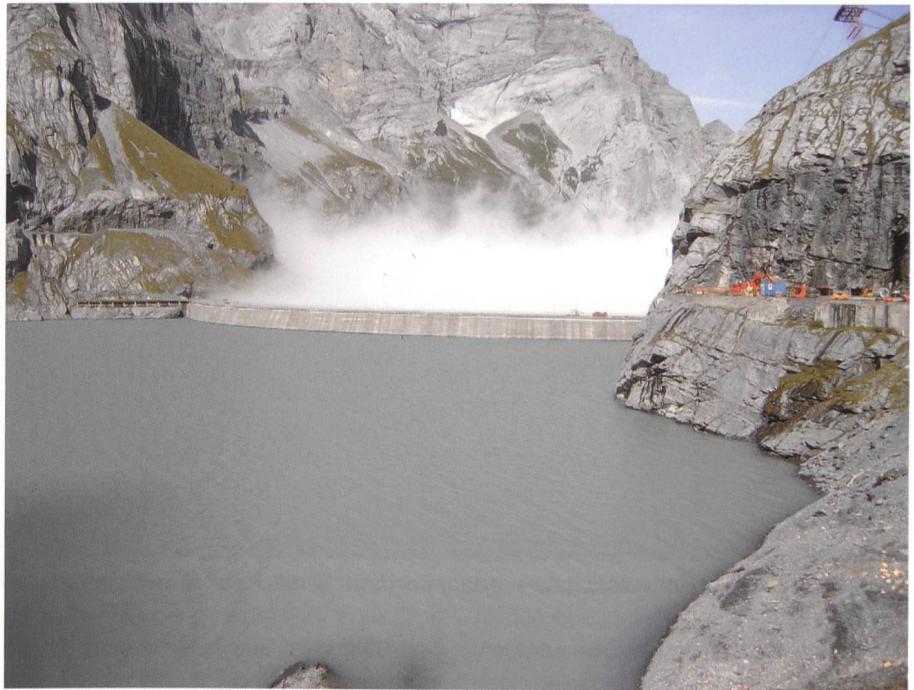
Bild 1. Der Speichersee Limmernboden ist das Herzstück der Kraftwerke Linth-Limmern, im heutigen und zukünftigen Betriebszustand.

Im Hinblick auf den Bau eines neuen Pumpspeicherkraftwerkes wurden die Glarner Konzessionen für die Kraftwerke Linth-Limmern in Linthal im Kanton Glarus im Jahre 2007 vorzeitig erneuert. Bei dieser Konzessionserneuerung mussten die Vorgaben der neueren Gesetzgebung wie Restwasservorschriften, Schutz- und Nutzungsplanung nach dem Gewässerschutzgesetz, Natur- und Heimatschutzvorschriften, Schwall/Sunk-Vorgaben, Heimfallregelung usw. umgesetzt werden. Die Berücksichtigung dieser Vorgaben in der Konzession erwies sich als ein komplexes Vorhaben, bei dem die verschiedensten Interessengruppen miteinbezogen werden mussten.