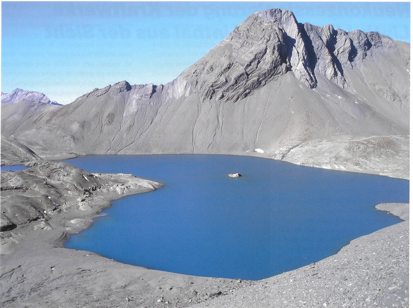
Bild 2. Die vorzeitige Konzessionserneuerung wurde im Hinblick auf den Höherstau des heute schon genutzten Muttsees beantragt.

den Glarner Konzessionen zu beantragen. Die Konzession für die beiden relativ kleinen Wasserfassungen auf dem Gebiet des Kantons Uri sollte in einer zweiten Phase erneuert werden. Beim Regierungsrat des Kantons Glarus wurde im Juni 2006 nach umfangreichen Vorarbeiten ein entsprechendes Konzessionsgesuch eingereicht.