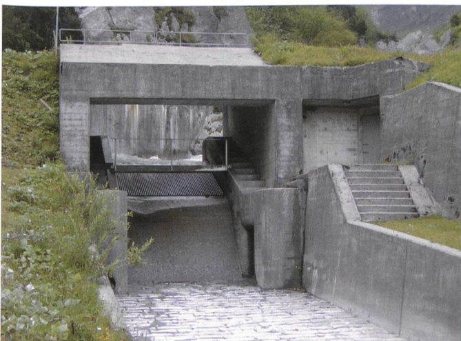
Bild 3. Die Fassung Wichlenbach ist eine der 25 Fassungen der Kraftwerke Linth-Limmern. Diese wird im Rahmen der Sanierung nach Art. 80 GSchG ab dem 1. Juli 2008 mit 60 \text{ l/s} und ab dem Beginn der neuen Konzession (1. Dez. 2016) gemäss den Vorgaben von Art. 32 des Gewässerschutzgesetzes mit 83 \text{ l/s} dotiert.

Aufgrund dieser Versuche wurde nach einer eingehenden Diskussion in der Begleitgruppe in der Konzession eine maximale Schwallmenge von 20 \text{ m}^3/\text{s} und eine minimale Sunkmenge von 2.5 \text{ m}^3/\text{s} festgeschrieben. Die genaue Auffahr- und Abfahrgeschwindigkeit sowie das Monitoring