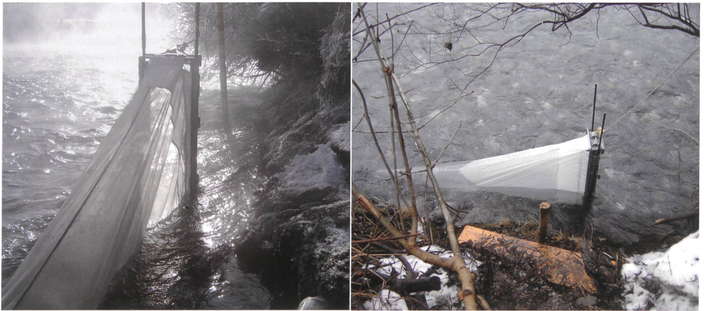
Bild 5. Die Auswirkungen von Schwall und Sunk auf die Linth wurde unter anderem anhand von Driftmessungen von abgetriebenen Organismen untersucht. Eine Driftmessung bei tiefem Wasserstand (Sunk).

zu den Auswirkungen sollen in der Energie-rechtlichen Bewilligung (Bewilligung der 2. Stufe) festgeschrieben werden.