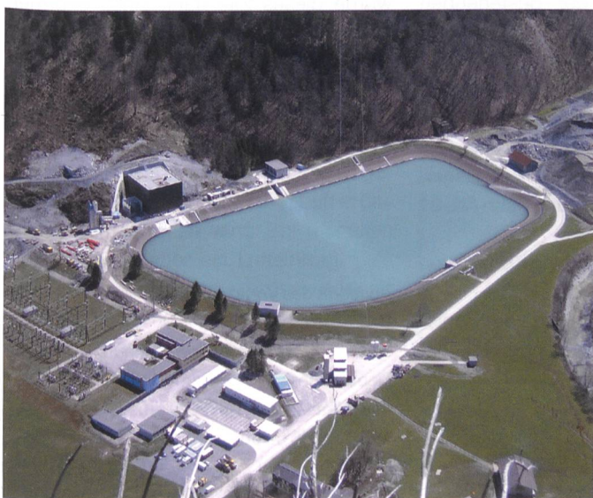
Bild 7. Die Kraftwerke Linth-Limmern verfügen jetzt schon über grosse Ausgleichsbecken bei der untersten Zentrale in Linthal vor der Abgabe in die Linth, im Tierfehd (s. Bild) und auf Hintersand.

Im Rahmen der Neukonzessionierung galt es nun, diese rund 150 Verträge bis zum Konzessionsende im Jahre 2096 zu verlängern. Dabei konnte von den Vertragspartnern eine Auszahlung der Entschädigung in der Form einer Einmalzahlung oder einer Rentenzahlung ausgewählt werden. Zahlenmässig am meisten Verträge sind für den Sernf von Wichlen bis nach Schwanden nötig. Die Verträge mit den grössten Bruttoleistungen sind im Raum Linthal, meist mit öffentlichen Körperschaften wie Gemeinden und Tagwen, erforderlich. Diese privaten Wasserrechtsverträge haben keinen Einfluss auf das öffentlich-rechtliche Konzessionsverfahren, vielmehr erlangen die KLL mit der Konzession das Recht, private Wasserrechtsbesitzer zu enteignen. Dieses Enteignungsrecht musste bei der Erstkonzession