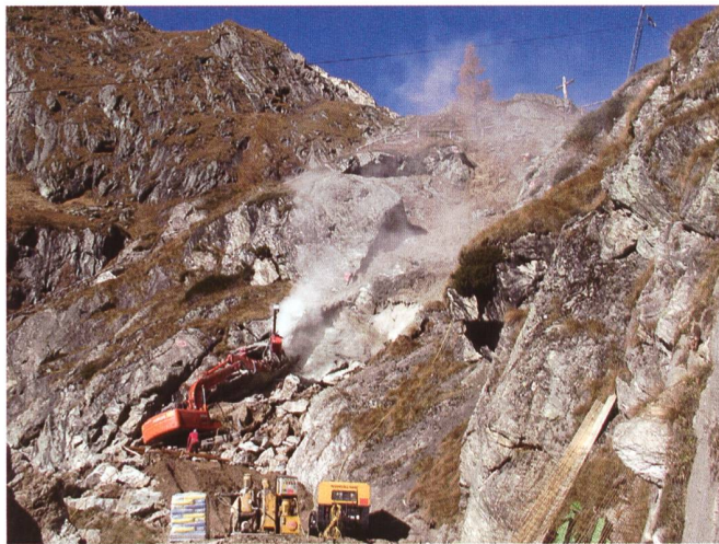
Bild 2. Sprengabtrag in einem Steilhang auf über 1900 m ü.M.

serführung im Sommerhalbjahr kommt es zudem zu beträchtlichem Überwasser. Im Winter wird zusätzlich ein Teil eines nahe gelegenen Seitenbaches ebenfalls mit einem kleinen Tiroler Wehr gefasst und in die Entsanderanlage beigeleitet, um in der Niederwasserperiode die Energieerzeugung zu erhöhen. Nach Einzug durch den Grobrechen (lichter Stababstand 138 mm) wird das Wasser-Feststoff-Gemisch in zwei 26 m langen Entsanderkammern bis zu einem Grenzkorndurchmesser von 0.3 mm entkiest und entsandet. Jede Kammer ist mit einem Entlastungsüberfall, einem Einlauf- und Spülschütz und drei Sohlmembranen versehen. Letztere registrieren die Geschiebeablagerung und lösen bei Erreichen eines voreingestellten Wertes den Spülvorgang aus. Das Wasser-Feststoff-Gemisch wird über einen knapp 50 m langen Spülkanal in den Dorferbach zurückgeleitet, die typische Spüldauer beträgt ca. 15 Min. Durch einen horizontalen Feinrechen gelangt das Triebwasser in eine Entnahmekammer und von dieser in die DRL.