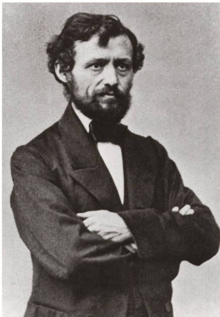
Bild 2. Carl Culmann, Professor für Ingenieurwissenschaften an der ETH Zürich von 1855–1881.