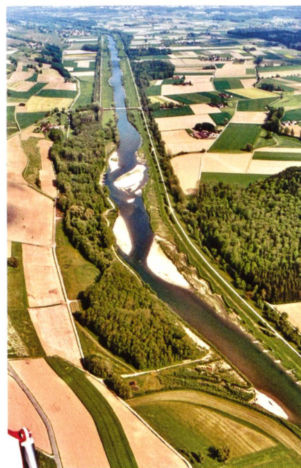
Bild 1. Thur beim Schafftäli, Kt. TG/ZH, vor der Revitalisierung (links) und nach dem Bau der Aufweitung (rechts).