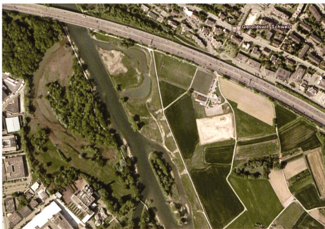
Bild 3. Flussaufweitung an der Limmat bei Geroldswil.

möglich, ein «post-treatment-design» zu verwenden. In diesem Fall werden revitalisierte Strecken mit ähnlichen, nicht revitalisierten Abschnitten innerhalb des Gewässers verglichen.