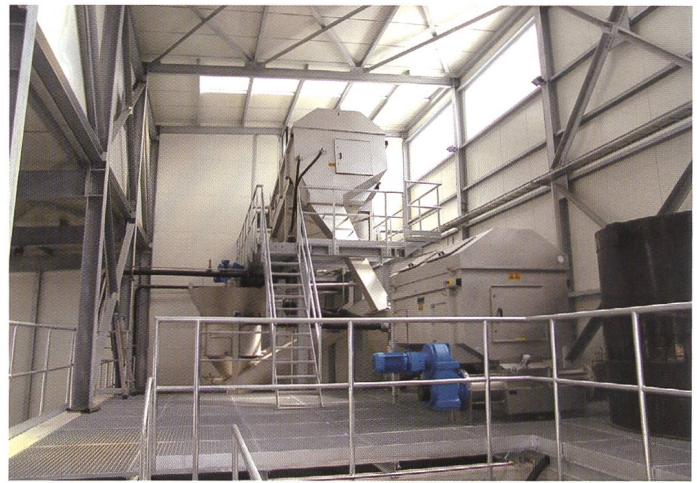
Bild 3. Die Prozesslinie der neuen Strassenschachtschlamm-Recycling-Anlage in Aarberg.