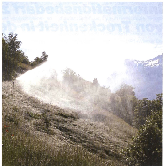
Bild 3. Bewässerung von Bergwiesen in Eggen (VS) (Quelle: Stefan Lauber, WSL).

Das Projekt DROUGHT-CH «Early recognition of critical drought and low