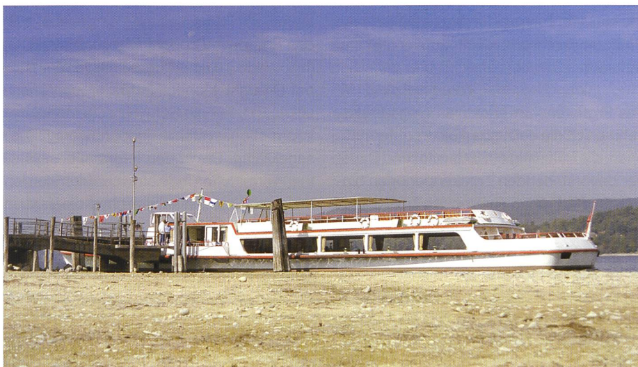
Bild 1. Die Schifflande in Mammern (TG) im Sommer 2003 (Quelle: Lukas Reimann, URh).

Ob Trockenperioden in den Sektoren, die auf die Verfügbarkeit von Wasser angewiesen sind, zu Problemen und Schäden führen, hängt einerseits von der Intensität und Dauer der Trockenperioden ab. Andererseits wird die Verwundbarkeit eines Sektors durch die bestehenden Möglichkeiten bestimmt, vorsorgend Gegenmassnahmen zu ergreifen und so Schäden