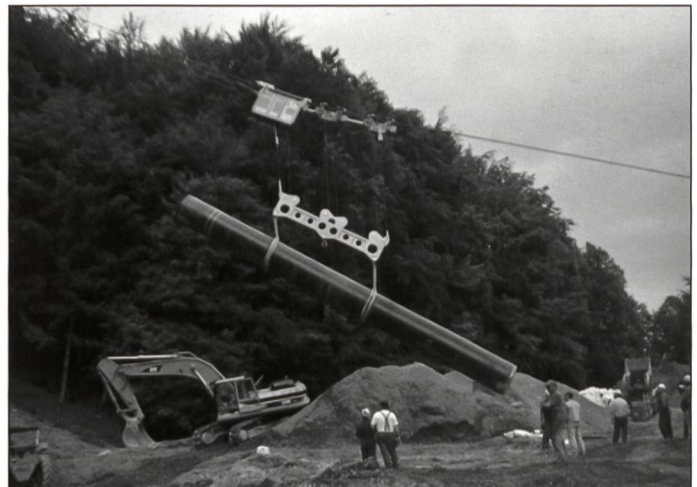
Transport und Versetzen Erdgasleitung, Rohrgewicht 12 Tonnen