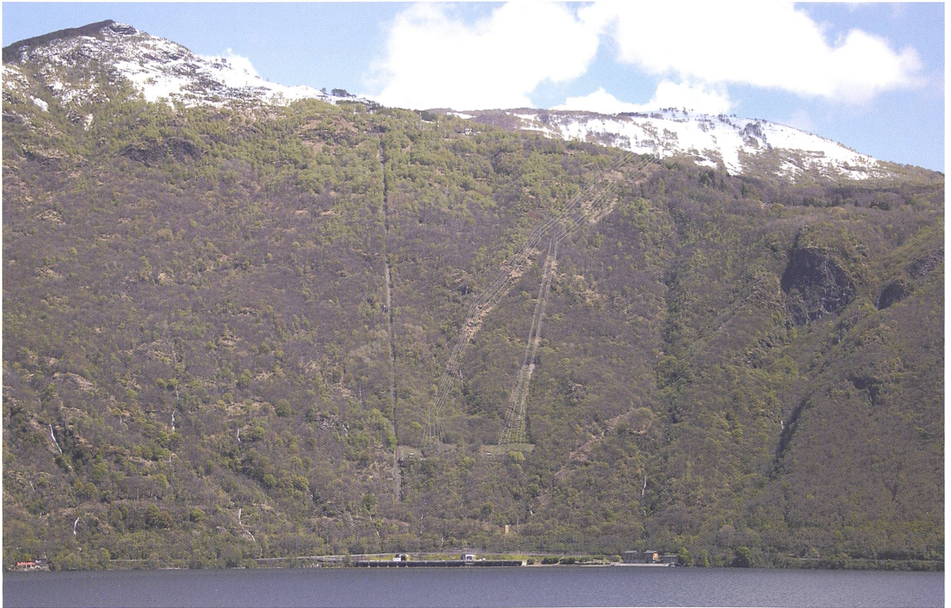
Bild 5. Pumpspeicher-Kraftwerk Ronco Valgrande und Monte Borgna am Ostufer des Lago Maggiore mit den Eingängen zur Kavernenzentrale, der Werkbahn zum Stausee und den Hochspannungsleitungen 380 kV.

realisierte Leistungssteigerung der vielen alten Flusskraftwerke. Diese lieferten 2010 immerhin 24%, das sind 16 Mrd. kWh, der schweizerischen Stromproduktion; von den Alpen-Stauseen kamen 32% (die Gesamtstromproduktion in der Schweiz inklusive Atomkraftwerke war 66.3 Mrd. kWh). In Kombination mit importierter Wind- und Sonnenenergie können unsere Stauseen ihren Beitrag vervielfachen.