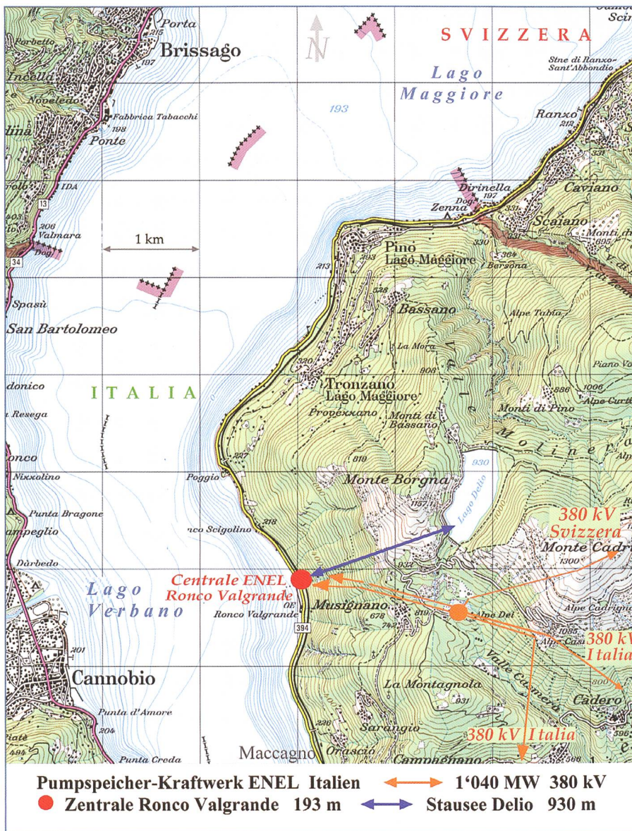
Bild 2. Ausschnitt aus der Landeskarte der Schweiz 1: 50 000, Nr. 286. Reproduziert mit Bewilligung von swisstopo (BA120156) vom 16.4.2012.

sind bei den alpinen Wasserkraftwerken schon seit langem üblich, im Wesentlichen zur Vorratshaltung für den Winter. Wenn es gelingt, im Hinblick auf den Atomausstieg die Pumpspeicherwerke