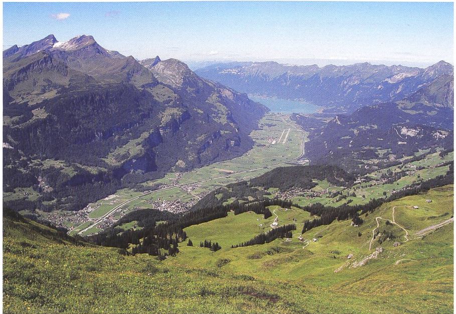
Bild 4. Die begradigte Aare im stark genutzten Talboden zwischen Meiringen und Brienz.

Auch das Herausnehmen von konfliktiven Punkten oder Teilprojekten aus dem Gesamtprojekt kann einen Weg darstellen, ein Projekt voran oder zu Ende zu bringen. Von dieser Möglichkeit sollte