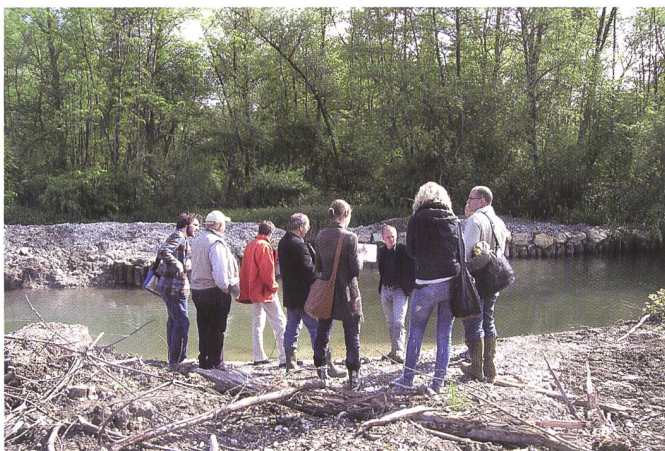
Bild 2. Ortsbegehungen schaffen auch den Rahmen für informellen Austausch (Einmündung Eichibach in Alte Aare).