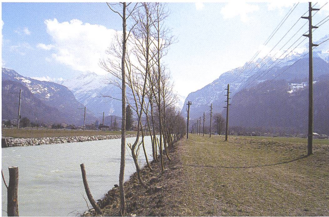
Bild 5. Die Vorländer-Orte an denen Interessen von Hochwasserschutz, Landwirtschaft und Ökologie oft aufeinander treffen (hier am Beispiel der Aare).

sich gezeigt, dass es sich positiv auf die Beurteilung des Mitwirkungsprozesses durch die Begleitgruppenmitglieder auswirkt, wenn die Projektleitung dieser Aufgabe nachkommt.