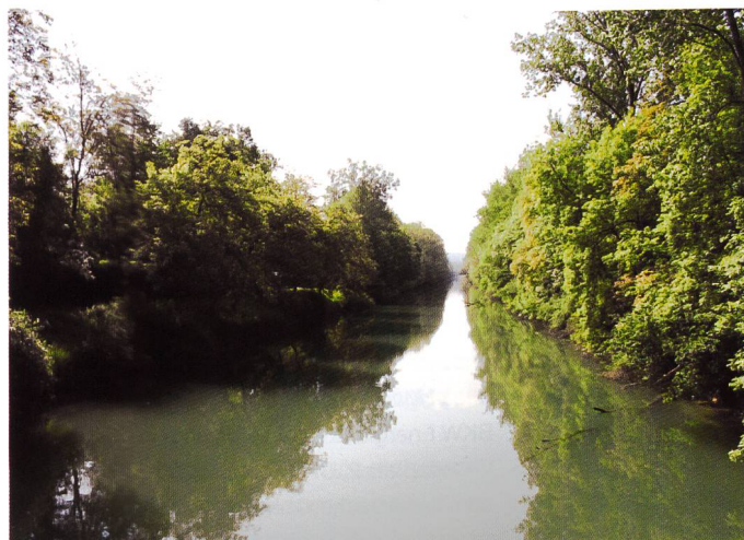
Bild 6. Kallnachkanal vor der Realisierung des Revitalisierungsprojekts (Quelle: Alnus AG).