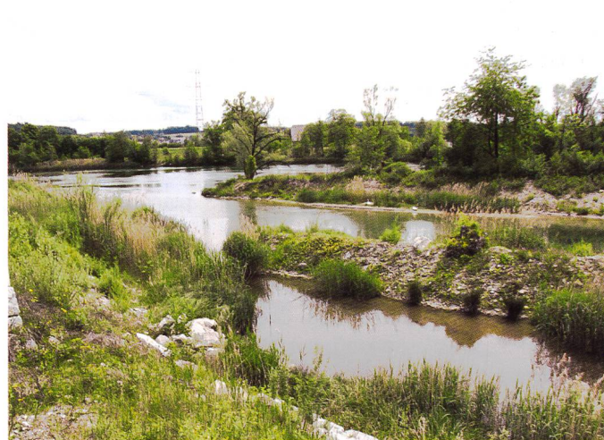
Bild 5. Stutzacher nach der Fertigstellung des neuen Seitenarms.