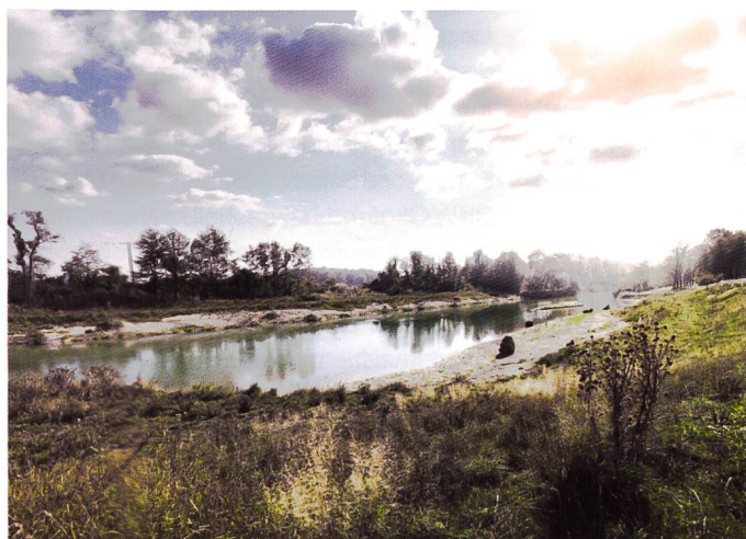
Bild 4. Der fertiggestellte Seitenarm vom Gauchert.

Die Kander wurde im letzten Jahrhundert durch Flussbegradigungen und Uferverbauungen in ein kanalähnliches Bett ge-