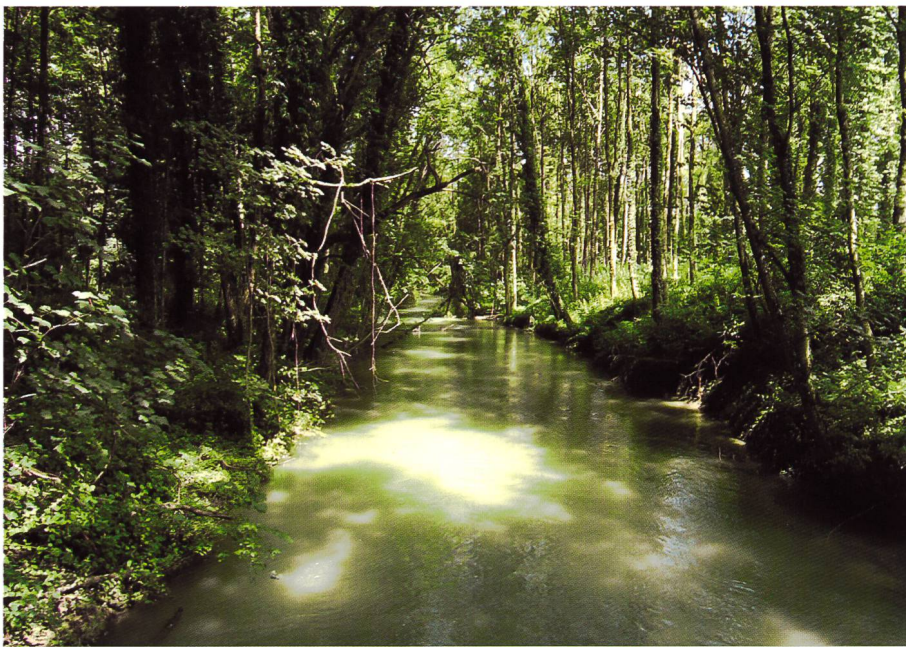
Bild 2. Alte Aare im alten Zustand vor der Realisierung des Projekts AARBiente III.