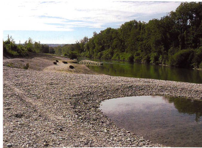
Bild 7. Neu geschaffene Flachwasserzonen und Amphibienteich im Kallnachkanal.