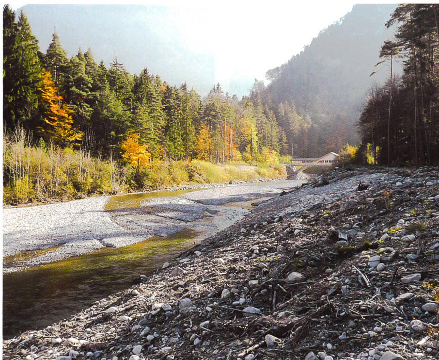
Bild 8. Simme Augand mit neu geschaffenen Kiesbänken.

Die BKW hat in den vergangenen Jahren mit den eigenen Wasserkraftwerken Aarberg, Kallnach und Niederried-Radelfingen sowie den Partnerwerken