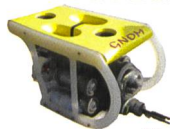
ROBOT SUBAQUATIQUE TAUCHROBOTER GNOM

Taucherarbeiten Wasserbauarbeiten Kranarbeiten Hafeninstallationen Vermietung Arbeitspontons Sedimentmanagement