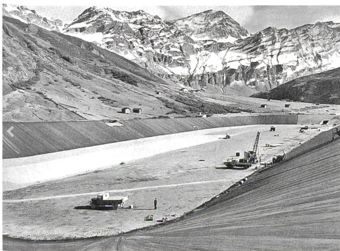
Bild 5. Die Kraftwerke Zervreila entstanden in den Jahren 1953–1958; im Bild der Bau des Ausgleichsbeckens Wanna im Safiental (Quelle: Bildarchiv Kraftwerke Zervreila).

Während der ersten Jahrzehnte – nachweislich bis mindestens ins Jahr 1983 – wurden diese Veranstaltungen gemeinsam mit dem Bündner Ingenieur- und Architektenverein (BIA) durchgeführt und fanden fast durchwegs in Chur statt. Später versuchte man, die Durchführungen «von Zeit zu Zeit im unteren Flussgebiet des Alpenrheins durchzuführen, um einen engeren Kontakt