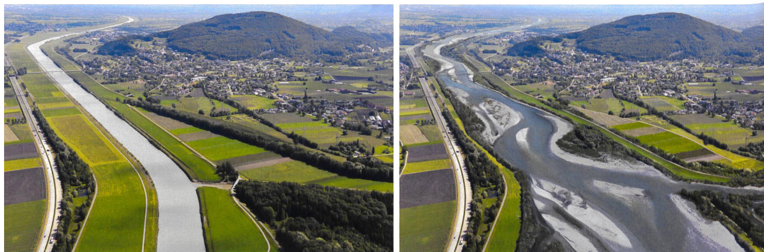
Bild 4. Der untere Alpenrhein heute (links) und wie er nach Umsetzung des laufenden Projekts künftig aussehen könnte (rechts) (Quelle: Hydra-Institute im Rahmen des Projekts RHESI, 2017).

Der Chronik zufolge hat sich der Rheinverband auch dafür eingesetzt, dass sich die NOK Ende der 50er-Jahre nach der zeitweisen Abkehr von Graubünden wieder für die Wasserkraftnutzung in der Region interessierte und die Ausbauiden am Vorder- und Hinterrhein weiter vorangetrieben wurden, wo letztlich ja auch weitere grosse Kraftwerksprojekte erfolgreich umgesetzt wurden, wie beispielsweise dasjenige der Kraftwerke Hinterrhein ( Bild 6 ).