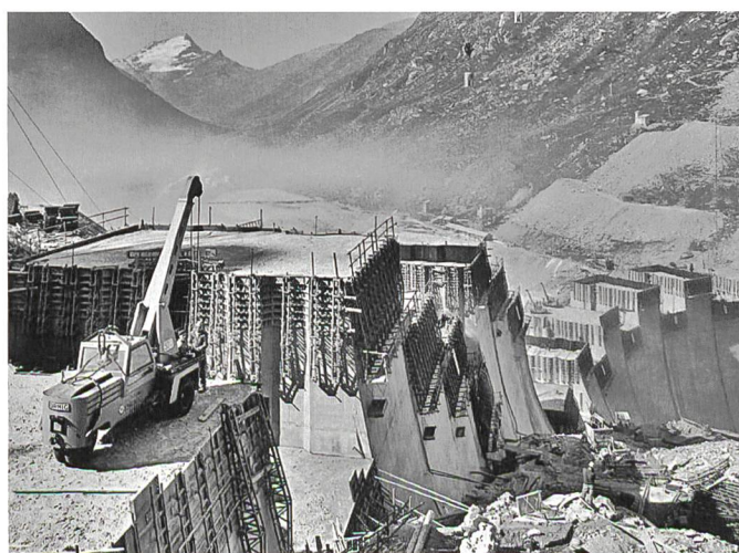
Bild 6. Die Kraftwerke Hinterrhein entstanden in den Jahren 1956–1963; im Bild der Bau des Staudamms im italienischen Valle di Lei (Quelle: Bildarchiv Kraftwerke Hinterrhein).