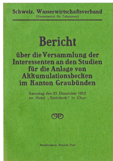
Bild 1. Bericht zur Versammlung am 21. Dezember 1912 als eigentlichem Startschuss zur Gründung.

Als erster Verbandspräsident wurde der Bündner Nationalrat Josef Dedual gewählt, der anschliessend während 22 Jahren die Geschicke des Verbandes leitete. Auch die weiteren an der Versammlung gewählten Vorstandsmitglieder waren durchwegs