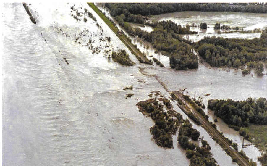
Bild 3. Dammbreach am unteren Alpenrhein bei Fussach während des Hochwasserereignisses 1987.

Mit dem zweiten Hauptanliegen, den Wildbachverbauungen und Geschiebesammlern in den Erosionsgebieten, zielte man auf die Verminderung des Geschiebeaufkommens und der Aufschotterung des Rheins, welche im Rheintal immer wieder zu verheerenden Hochwasserereignissen beigetragen hatte, so unter anderem 1910 und 1927 sowie in neuerer Zeit auch 1954, 1987, 1999 und 2005 (Bild 3).