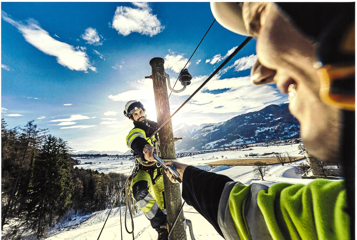
Hand in Hand: Repower hält Ihre Anlagen mit Wartungsarbeiten in Schuss.

Im Auftrag von Swissgrid durfte Repower als Generalplanerin das neue 220-kV-Unterwerk in Avegno planen, die Ausführung begleiten und im letzten Jahr auch die Inbetriebsetzung leiten. Im Schweizer Übertragungsnetz ist das Unterwerk Avegno eine wichtige Schaltanlage. Sie erhöht die Versorgungssicherheit im regionalen Verteilnetz wesentlich. Ausserdem wird in Avegno das Wasserkraftwerk Verbano an