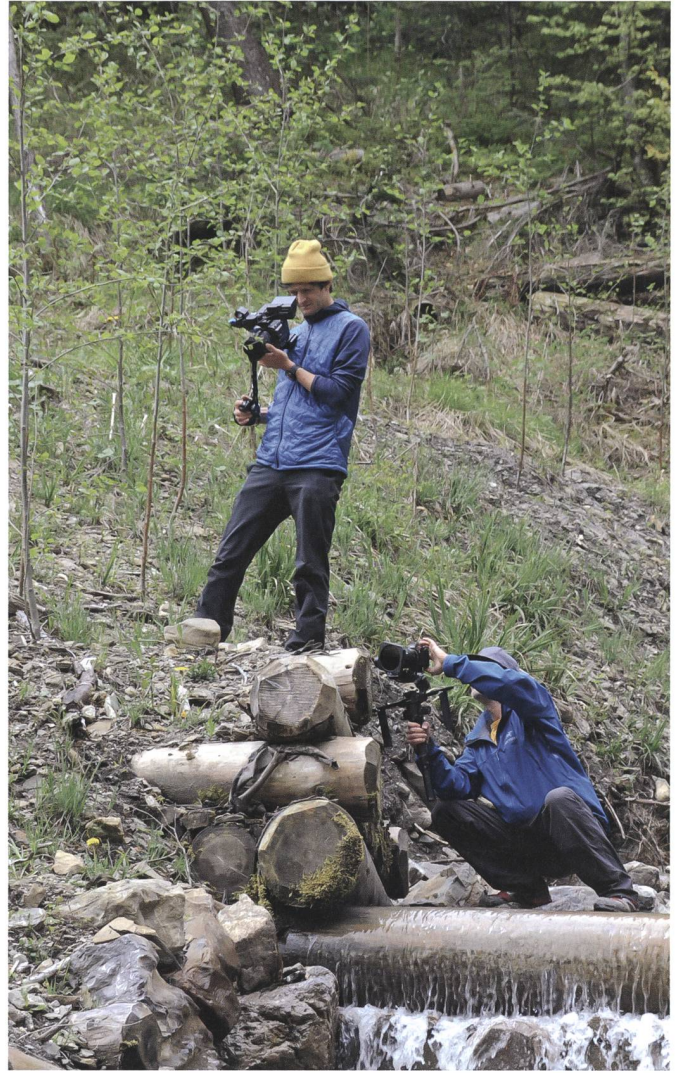
Das Produktionsteam der Matthias Lüscher GmbH ist bereit für die Filmaufnahmen im Gebiet des Meierisli-Grabens.