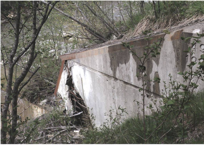
Starke Beschädigungen an der Sperre 49. Der linke Sperrenflügel wurde durch die Rutschung ins Unterwasser weggedrückt.