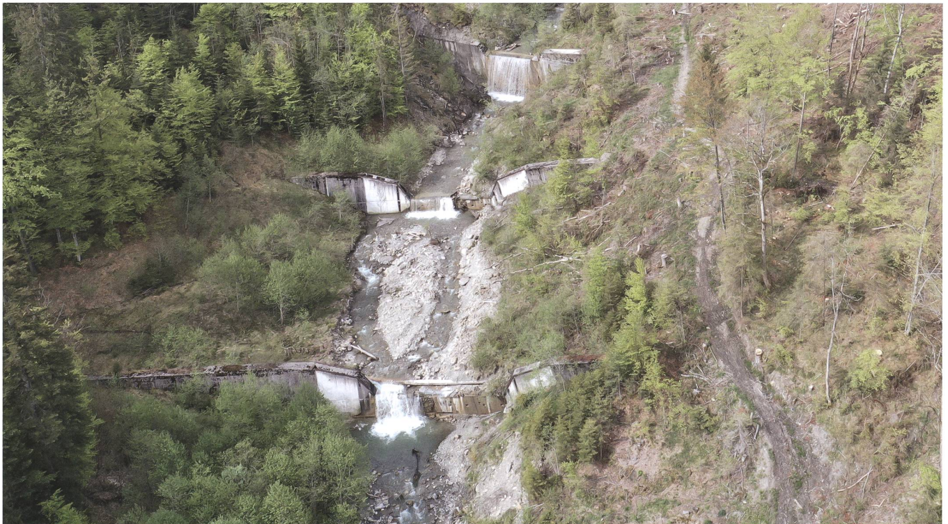
Stark beschädigte Sperren im Gebiet der Meierisli-Rutschung. Die unterste Sperre 33 ist im Bild unten auf Seite 173 im Detail zu sehen.