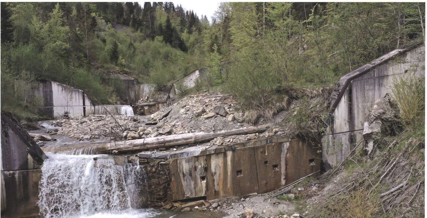
Detailansicht der starken Beschädigungen an der Sperre 33. Die Sperre ist stark verkippt und weist grosse Betonabplatzungen auf.