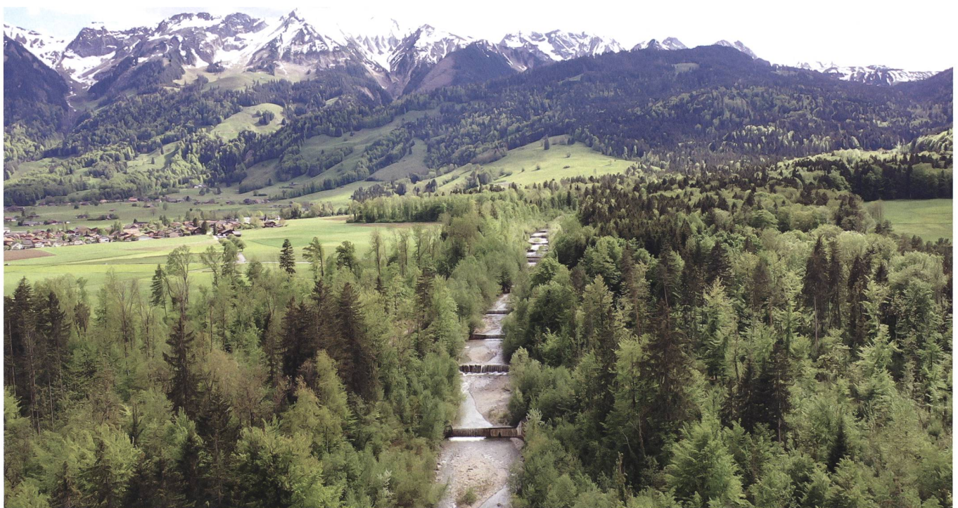
Sperrentreppe in der Gürbe im Gebiet oberstrom der Ausschütte bis Blumensteinbrücke.