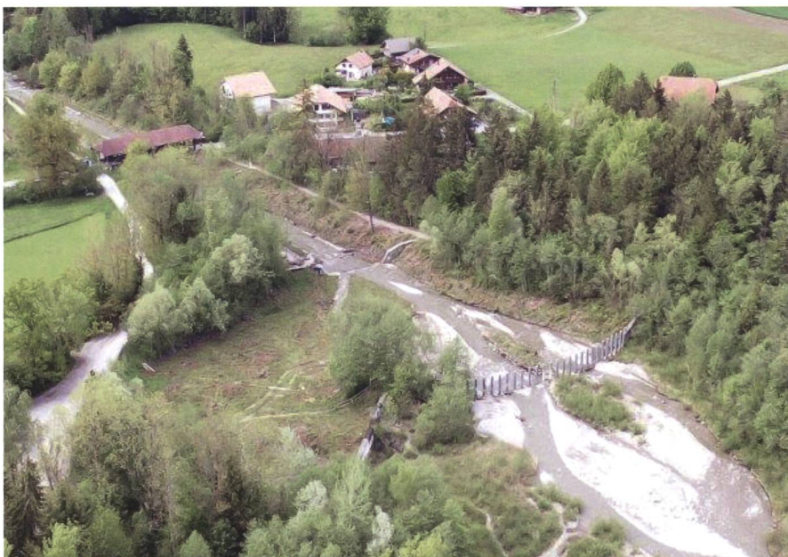
Luftaufnahme des unteren Teils der Ausschütte mit dem Schwemmholzurückhaltebauwerk. Links vom Schwemmholzurückhaltebauwerk befindet sich die Tauchwand, welche im Überlastfall überströmt werden kann.

Dr. Jürg Speerli, Vorsitzender der KOHS, Ingenieurbüro Speerli GmbH, speerli@iswb.ch