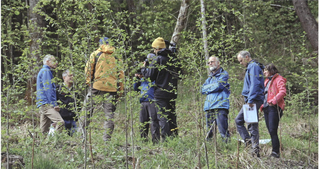
Besprechung des Produktionsablaufs für den Posten Meierisli-Graben.

verbauungen stark beschädigt. Das gab den Anlass, die jahrzehntealte Schutzstrategie zu überdenken. Dabei ist neben den Bedingungen im Oberlauf der Gürbe auch ein Blick auf die Verhältnisse auf dem Schwemmfächer und im Unterlauf des Flusses notwendig. Im Anschluss an den Film stand pro Posten eine Person für Fragen und eine Diskussion, welche durch Lukas Hunzinger geführt wurde, zur Verfügung.