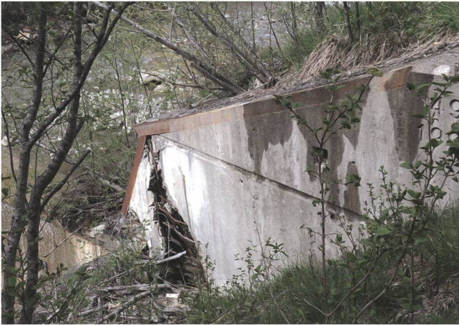
Starke Beschädigungen an der Sperre 49. Der linke Sperrenflügel wurde durch die Rutschung ins Unterwasser weggedrückt.