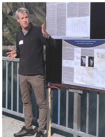
Bild 4: Fachpersonen informierten die Teilnehmer auf der Staumauer an fünf interessanten Posten.

Am nächsten Morgen fuhren vier Busse kurz vor acht Uhr vor dem Kongresszentrum ab. Auf schmalen Strassen mit steil abfallendem Gelände, durch enge Galerien und Tunnel dauerte die Fahrt rund eine Stunde bis zur Zeuzier-Staumauer. Die perfekt dem Tal angepasste, asymmetrische Mauer wurde erst sichtbar, als man sich schon fast auf ihr befand. Die auf fünf Gruppen verteilten Besucher konnten in einem Postenlauf jeweils rund 30 Minuten einer Fachperson zuhören, die einen