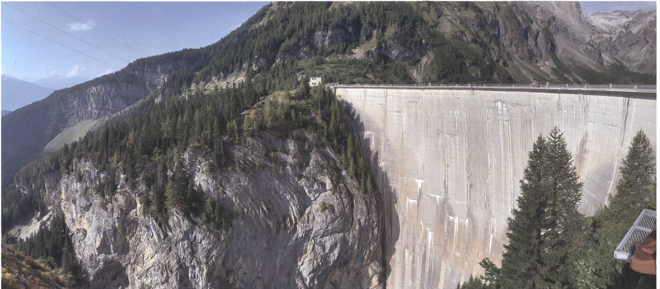
Bild 3: Die perfekt dem Tal angepasste, asymmetrische Zeuzier-Staumauer.

gezeichnet. Im Sommer 1979 wurde dann als Ursache eine Talverengung bestätigt. Diese konnte auf Setzungen zurückgeführt werden, die durch den Vortrieb des Sondierstollens «Rawyl» entstanden waren. Um die Risse zu schliessen, wurden 80000 Liter Epoxydharz in die Mauer injiziert und so konnte eine statische Kontinuität wiederhergestellt werden. Durch die Injektionen wurden zwar die Verformungen stabilisiert, die Talverengung entwickelt sich jedoch beinahe linear weiter.