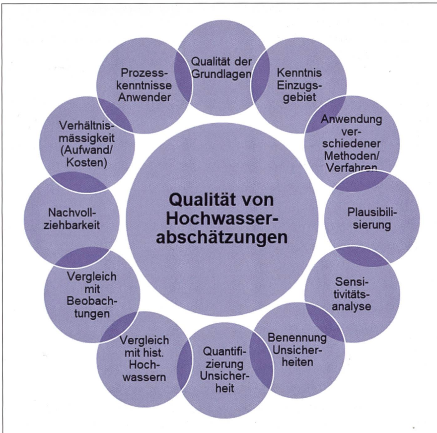
Bild 2: Wesentliche Punkte zur Verbesserung der Qualität von Hochwasserabschätzungen (Abflüsse und Volumina).