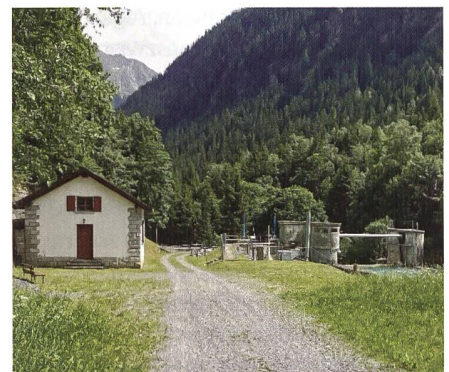
KW Meiental; Bild: CKW.

Aufgrund der grossen Produktionsmenge gilt das Kraftwerk Meiental gemäss Schweizer Energiegesetz als Kraftwerk von nationaler Bedeutung. Das nationale öffentliche Interesse an einer sicheren Stromproduktion geht somit regionalen Schutzinteressen vor. Weiter ist es für den Kanton Uri ohne dieses Kraftwerk nicht möglich, sein gesetztes Ausbauziel auf eigene Energieproduktion von 150 GWh realisieren zu können.