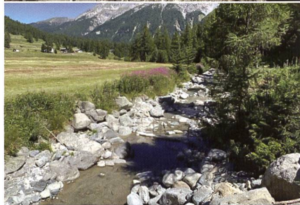
Wasserfassung und Vallember unterhalb Fassung; Bild: SWV.

nisse, die diese wesentlich beeinträchtigen, müssen saniert werden. Aus verschiedenen geprüften Varianten zeigte sich die aktuell im Bau stehende Lösung als Bestvariante. Dabei können die Fische im rechtsufrigen Bereich mittels einer Fischtreppe vom unteren in den oberen Flusslauf aufsteigen. Der Höhenunterschied zwischen Ober- und Unterwasser wird dadurch abgebaut, dass Wasserbecken mit dazwischenliegenden Trennwänden gebaut werden.