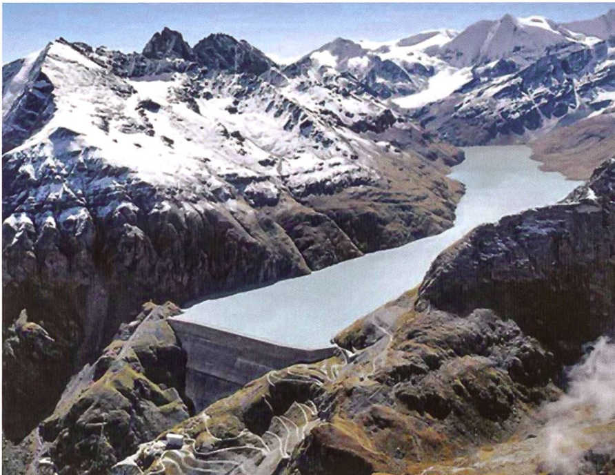
Das «Hydro Alps Lab» steht für anwendungsorientierte Forschung und Entwicklung.

Um diese kritischen Bauteile zu dimensionieren, führen die Teams des Hydro Alps Lab numerische Simulationen und Messungen sowohl im Labor als auch vor Ort durch. Auch die Studierenden können sich im Rahmen ihrer Bachelorarbeiten oder anderer Projekte mit diesen Problematiken beschäftigen und zum Beispiel präzise Analyseverfahren entwickeln.