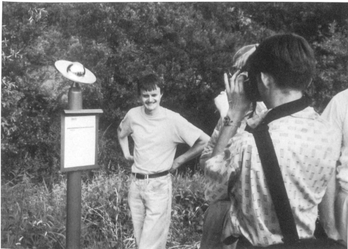
Die Planetenstation «Saturn» anlässlich der Erstbegehung.

Eine der astronomischen Informationstafeln.