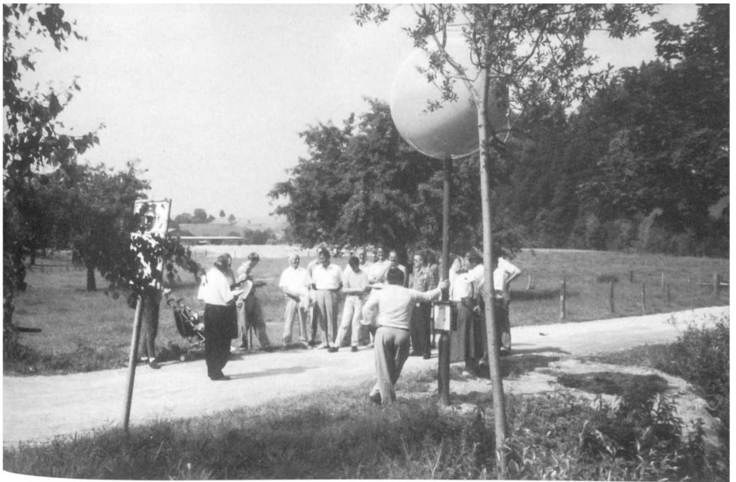
Die «Sonne», Ausgangspunkt des Planetenweges, anlässlich der Eröffnung Anfang Juli.

deren Arbeitsgruppe Tourismus. Sie hofft, damit einen weiteren Grundstein gelegt zu haben zur Förderung des qualitativen Tourismus. Der Planetenweg soll aber auch ein Geschenk an die Einheimischen und ein lehrreiches Arbeitsinstrument im Schulunterricht sein.