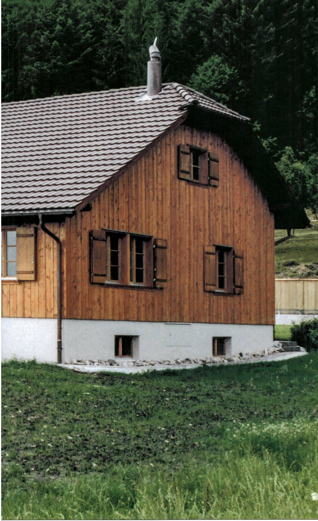
Das 1989 fertiggestellte neue und grosse Schützenhaus auf der Brestenegg.