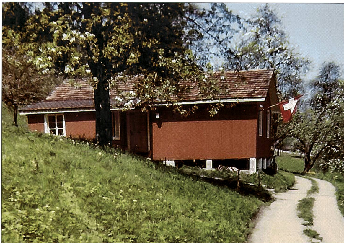
Das erste Armbrustschützenhaus auf der Brestenegg.