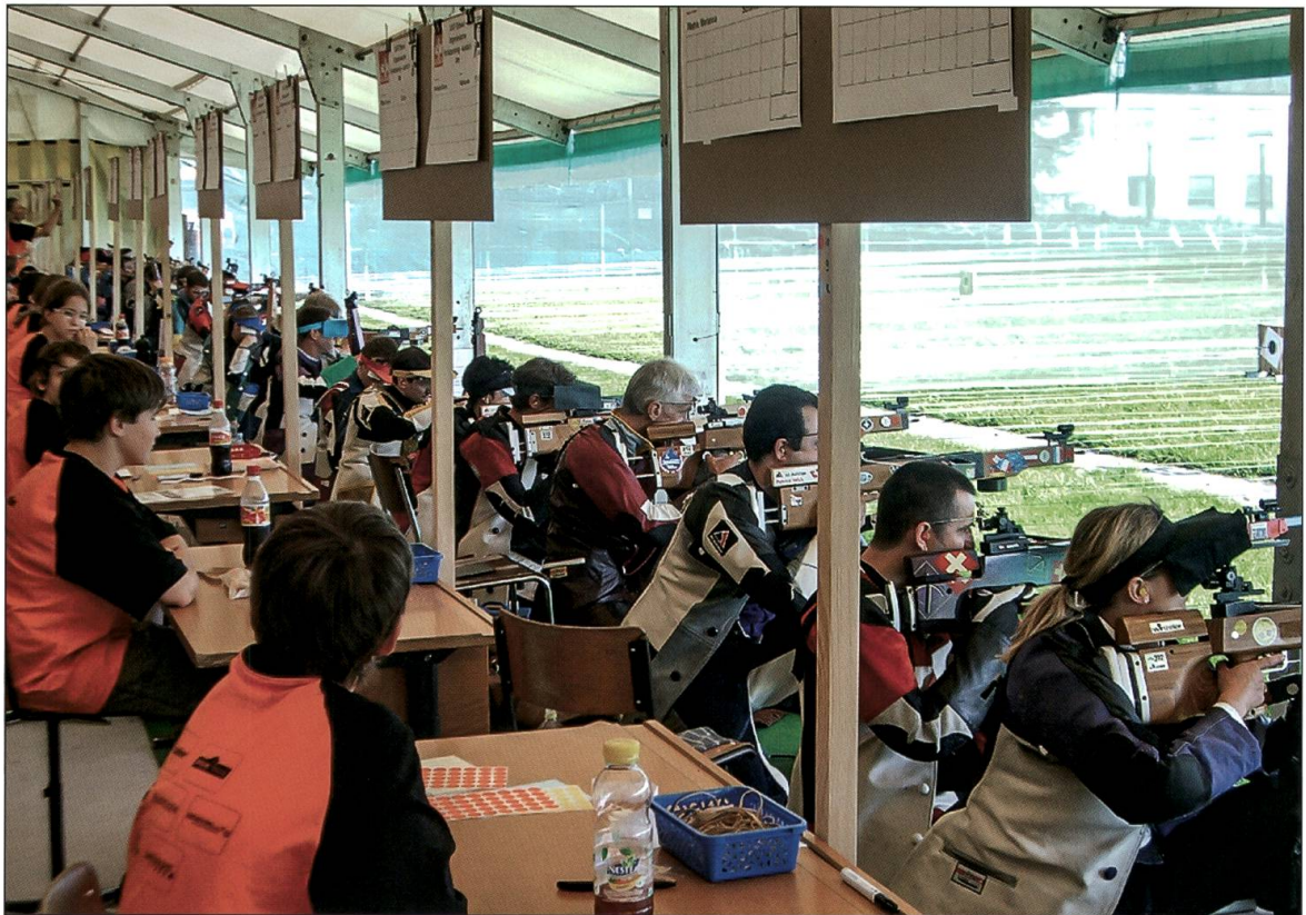
Schützenkönigausstich anlässlich des Eidgenössischen Armbrustschützenfestes 2006 auf dem Schulhausareal in Ettiswil.