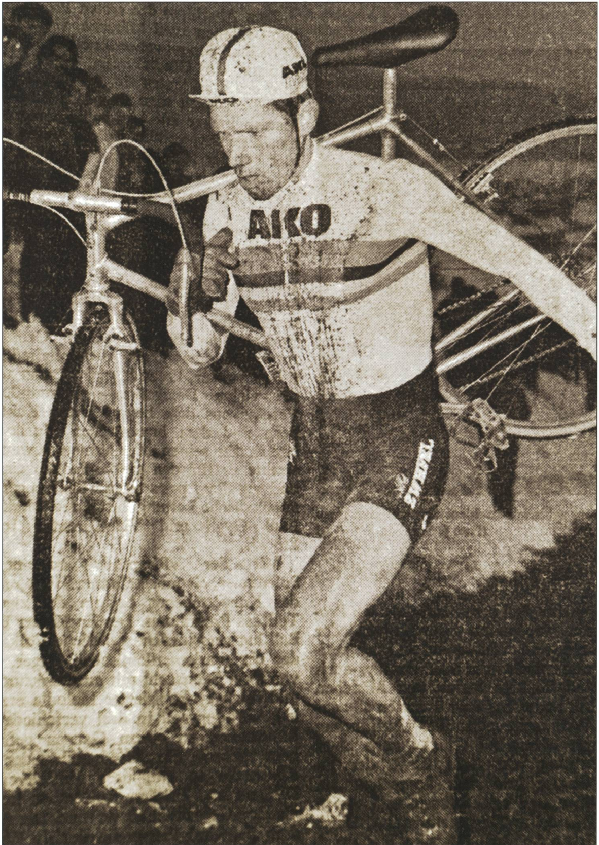
Der fünfmalige Radquer-Weltmeister Albert Zweifel (Aufnahme von 1979) gewann die ersten sieben Austragungen des Dagmerseller Radquers. Als Rekordsieger wird er 2014 vom Franzosen Francis Mourey abgelöst.