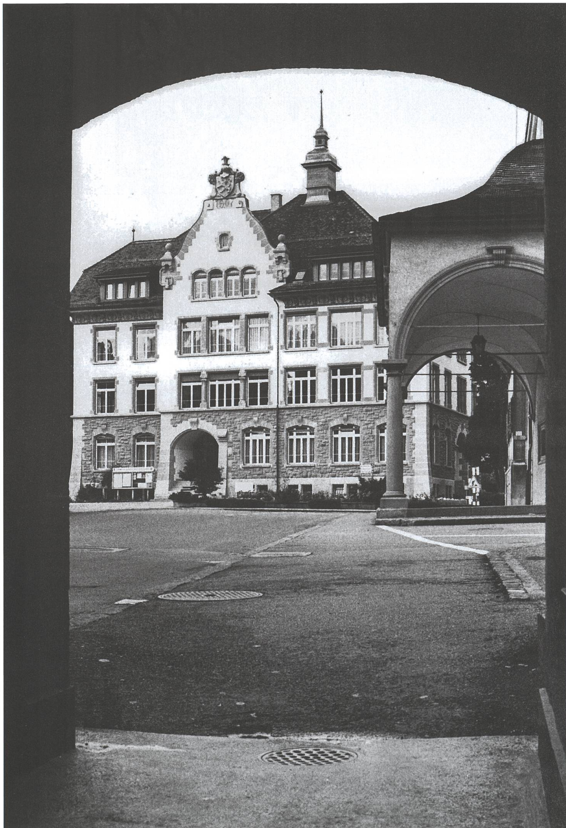
Das alte Schulhaus Willisau-Land diente auch als Vereinslokal und der privaten Kaufmännischen Fortbildungsschule mit Unterrichtsräumen.