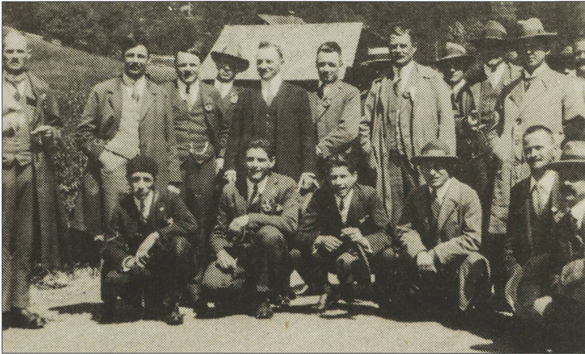
Vereinsausflug ins Saanenland, 1927: einige der 32 am Ausflug teilnehmenden Mitglieder. Dokument «Willisauer Bote», 3.9.1987

Logos Verein junger Kaufleute Willisau seit 1912.