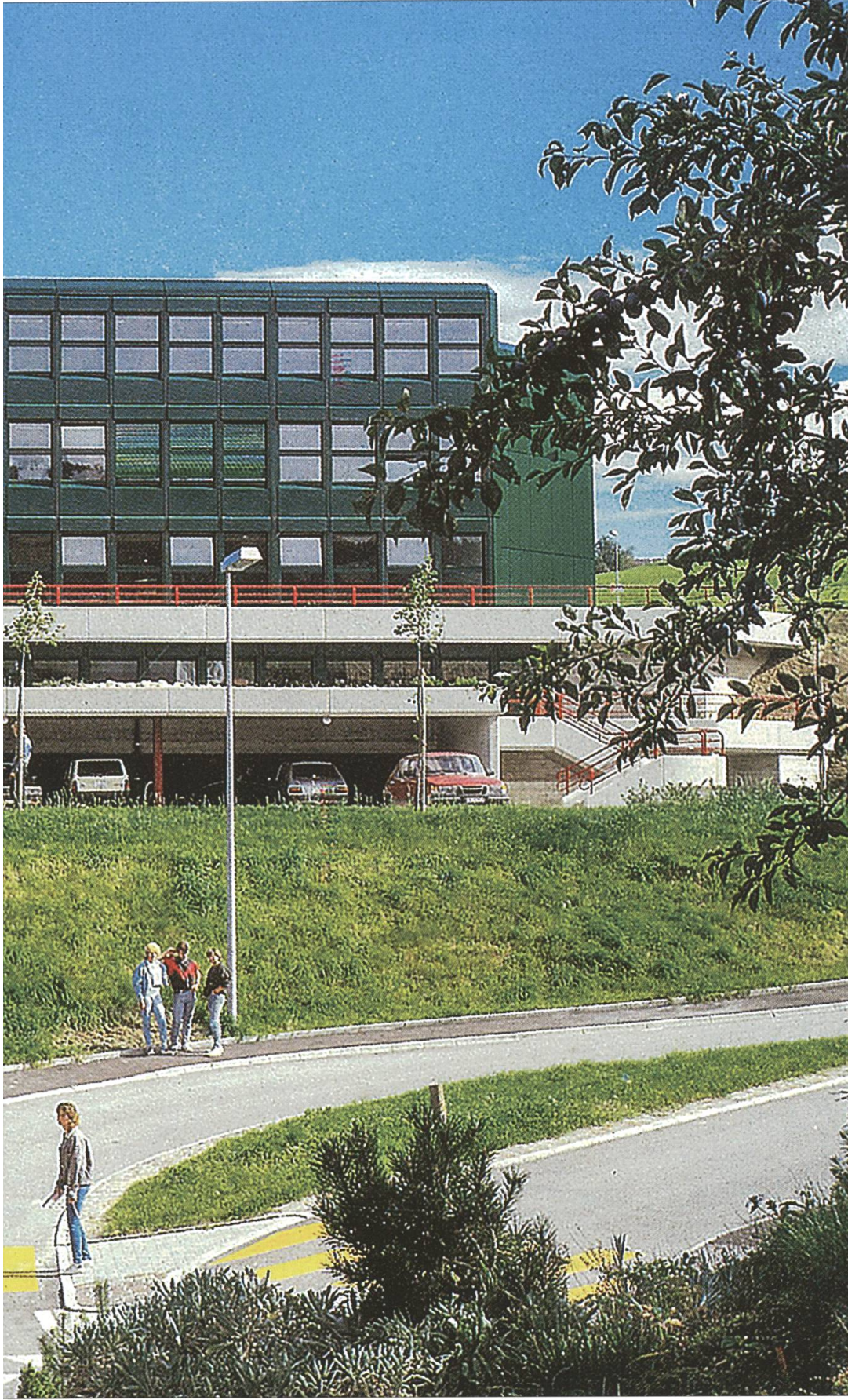
Das 1985 bezogene heutige Berufsschulbaus für die Kaufmännische und Gewerbliche Berufsschule sowie für das Weiterbildungszentrum WBZ.