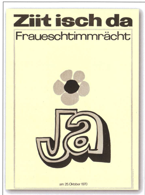
Abstimmungsplakat zur kantonalen Abstimmung in Luzern 1970.