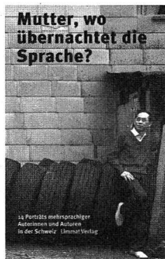
Mutter, wo übernachtet die Sprache? 14 Porträts mehr- sprachiger Autorin- nen und Autoren in der Schweiz

200 S., 30 Fotos farbig, Pappband, Fr. 29.50