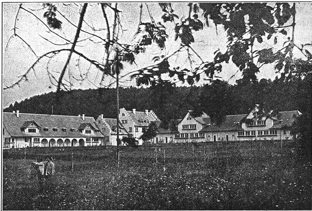
Wohnkolonie „Schweizersbild“ der A.-G. der Eisen- und Stahlwerke, Schaffhausen