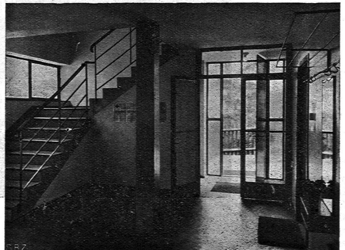
Haus für alleinstehende Frauen „Zum neuen Singer“, in Basel Wohnraum im „Erdgeschoss“ des Gartenflügels