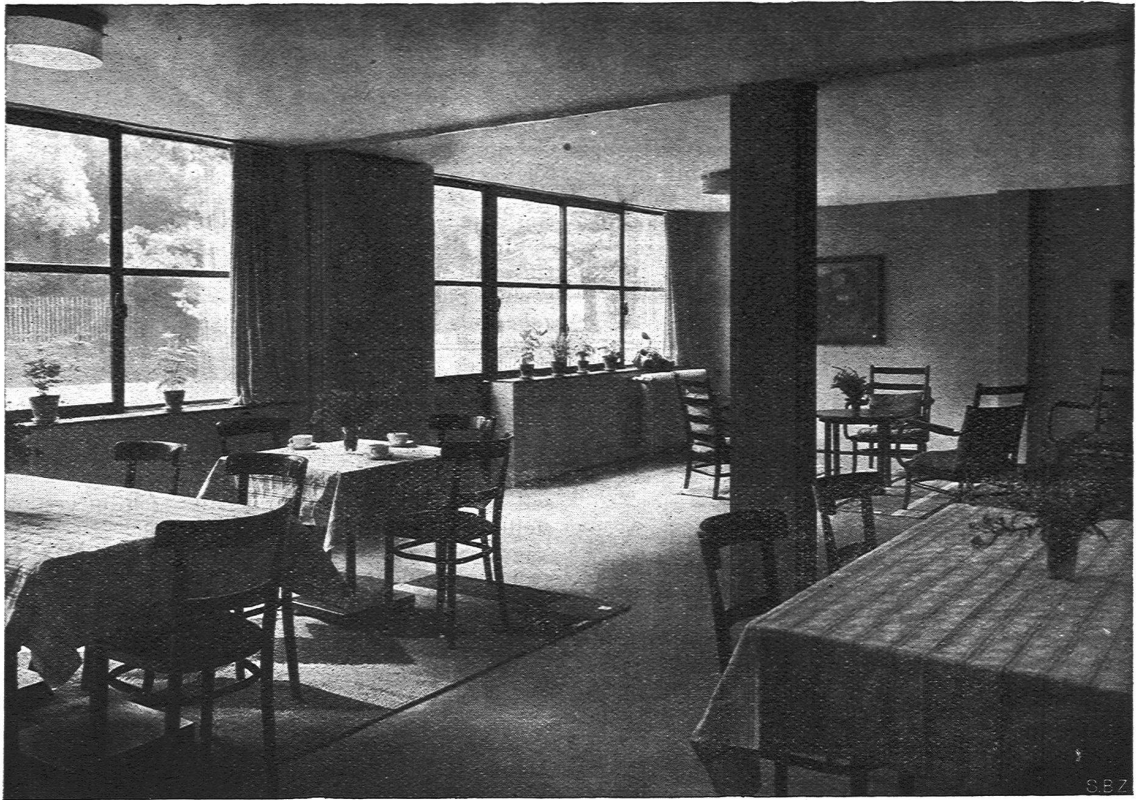
Haus für alleinstehende Frauen „Zum neuen Singer“ in Basel (Oben) Wohn- und Essraum mit zurückgeschlagener Faltwand. (Unten) Appartement.