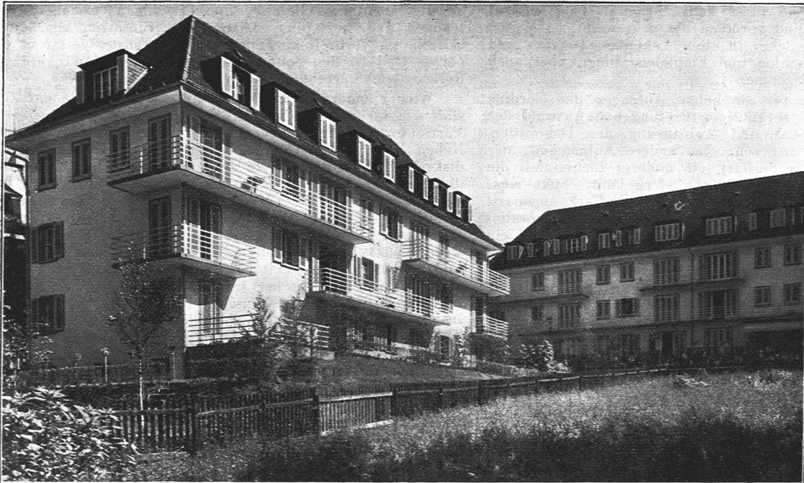
Bauten an der Beckenhofstrasse (Baugenossenschaft berufstätiger Frauen Zürich)