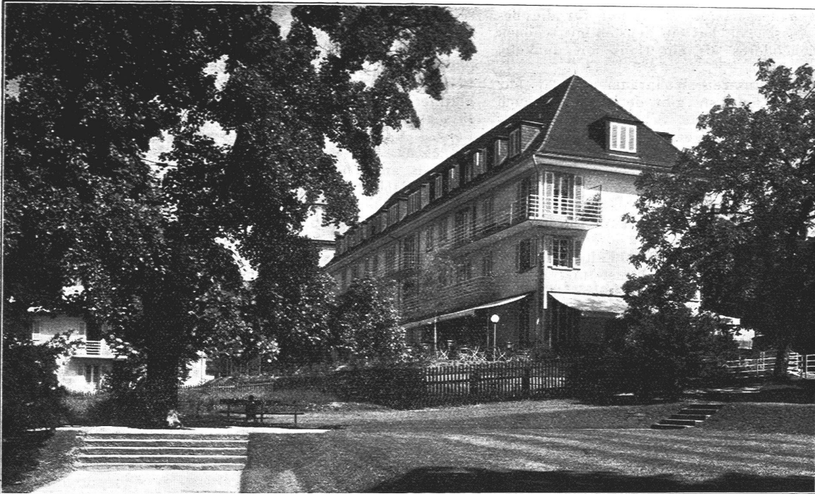
Bauten an der Beckenhofstrasse - Seitenansicht (Baugenossenschaft berufstätiger Frauen Zürich)