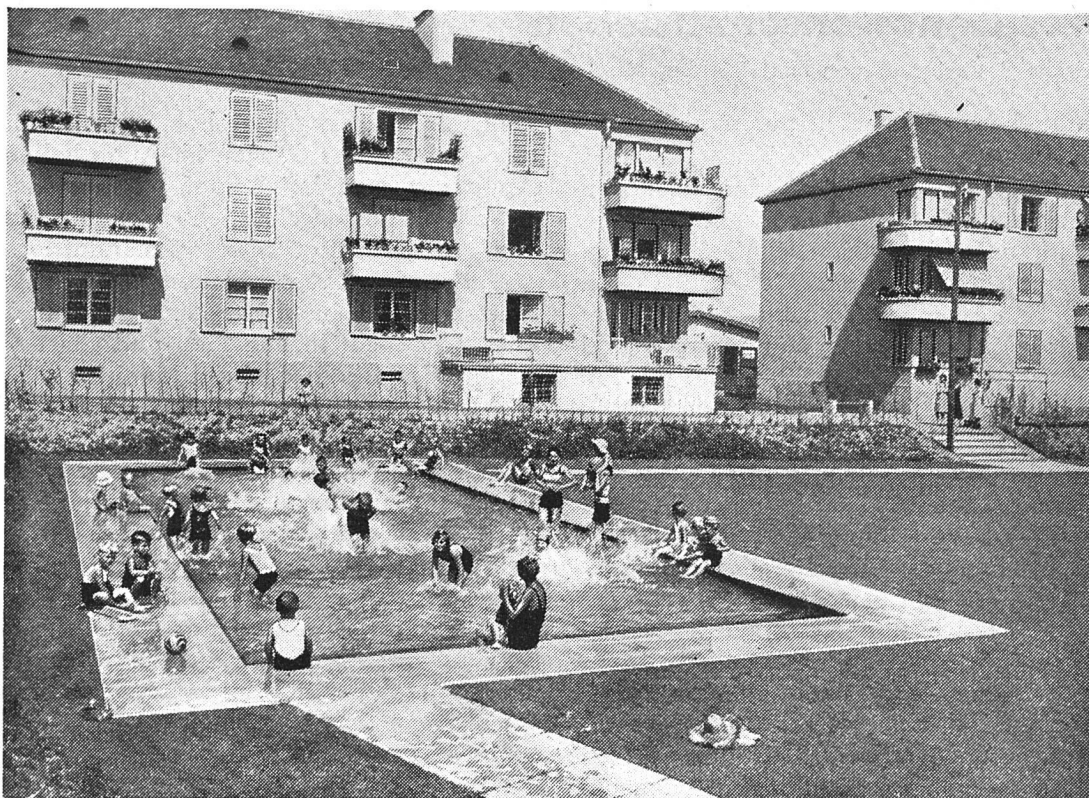
Planschbecken (G. B. A.)

verständlich auch einen Einfluss auf die Vermietbarkeit der Wohnungen, wenigstens in Genossenschaften, wo Kinder nicht als unerwünscht gelten, und das sollte ja in gemeinnützigen Baugenossenschaften nicht der Fall sein. Schwieriger ist die Sache natürlich, wenn kein Platz vorhanden ist. Bei Neubauten sollte schon bei der Projektberatung auf diese Frage Rücksicht genommen werden. Es liegt oft nur an den Vorständen, dass sie den Architekten ihre diesbezüglichen Wünsche bekanntgeben. Mit etwas gutem Willen lässt sich vieles machen.