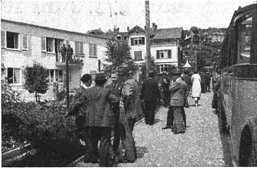
Man dringt in das Innere einer Flachdachkolonie

schaftliche Genüsse. Der Lichtbildervortrag vom Samstagabend von Architekt Kellermüller führte aufs Trefflichste ein in die Siedlungsgeschichte Winterthurs und die Arbeit der Genossenschaften. Unser Organ «Das Wohnen» brachte sich mit einem geschmackvoll arrangierten Stand im Tagungslokal, mit für die Tagung erstellten Notizblocks und mit weiterer Literatur in Erinnerung. Das Mittagessen im Kasino verlief wohl zur vollen Zufriedenheit aller Teilnehmer, und die meisten derselben liessen es sich nicht nehmen, auch noch unserer Kyburg einen Besuch abzustatten, wobei uns die Baudirektion des Kantons Zürich in freundlicher Weise die Eintrittsgebühr ermässigt hatte. Verschiedene Winterthurer Firmen hatten uns ihre Präsente überreicht. Kurzum: es klappte alles vorzüglich.