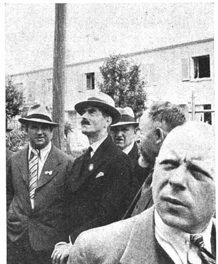
Bild rechts: Unser Zentralpräsident bezieht sich neueste Kolonien