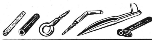
Dübel, Schrauben und Haken als praktische Helfer im Haushalt

Für jede Wand geeignet ist ein « Patent-Steinwandhaken » aus Stahlrohr, meist vermessingt. Das Rohr ist an dem einen Ende angeschärft, am andern Ende ist der Haken festgenietet. Das Rohr biegt sich beim Einschlagen nicht und bricht auch bei einem ungeschickten Schläge nicht ab. Man treibt diesen Haken am besten mit leichten, schnellen Schlägen ein und dreht ihn, solange er noch im Putz geht, nach jedem Schlag ein wenig, muss aber darauf achten, dass er nachher in der richtigen Lage sitzt. Beim Einschlagen bildet sich in dem in die Wand eindringenden Rohr ein fester Steinkern, der ihn unverrückbar in der Wand festhält. Einen solchen