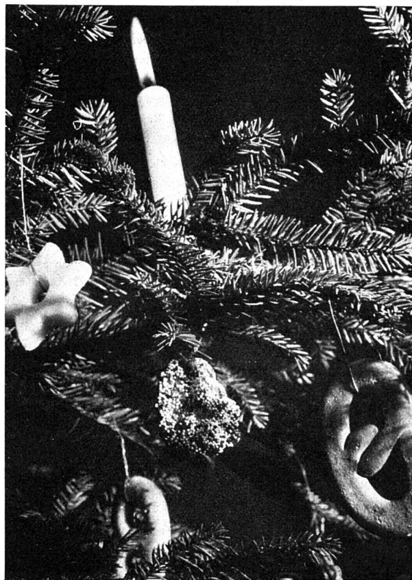
Bild 2. Die älteste und heute wieder vielfach übliche Art den Christbaum zu schmücken. Es wird auf jeden eigentlichen Schmuck verzichtet. Auf den grünen Aesten stehen lediglich Kerzen und daneben werden vielleicht noch etwas Backwerk und vielleicht noch einige Äpfel und Nüsse angehängt

Welche von den drei Arten, den Christbaum zu schmücken, ist die richtige? Keine, oder vielmehr alle drei. Es läßt sich hier kein Schema aufstellen. Alles kommt auf die Umstände und den Geschmack des einzelnen an. Wir glauben, die übliche Art des Christbaumschmucks, wie sie auf Bild 1 dargestellt ist, gilt heute vielfach als unmodern. Aber, was macht das aus? Wenn irgendwo, so kommt es hier nicht darauf an, mit der Mode zu gehen. Mögen die einzelnen Anhän-