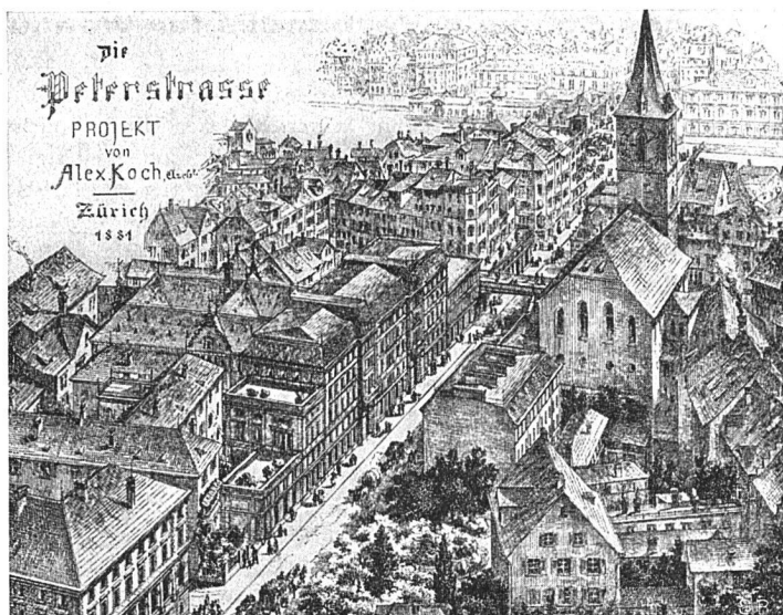
Durchbruch-Projekt Bahnhofstraße-Weinplatz (Rathaus), 1881

Sollen wir noch berichten von der Ausstellung in Zahlen ? Man prüfe und studiere sie selbst, diese zweckvoll und bis in alle Einzelheiten hinein durchdachten Ausstellungsgebäude, denen man kaum mehr die Bezeichnung »Hallen« geben darf, weil sie so eigenwillig jede ihr besonderes Gesicht zeigt. Auf 300 000 Quadratmeter Boden sind insgesamt 700 000 Kubikmeter umbauter Raum entstanden! Und trotzdem konnten 85 000 Quadratmeter Grünflächen und mußten noch 70 000 Quadratmeter Straßenflächen ausgespart werden. 370 000 Quadratmeter Holzschnittwaren mußten verbaut werden und 14 000 Kubikmeter Bauholz fanden Verwendung. Allein an Glas verbrauchte man 24 000 Quadratmeter, und 110 000 Quadratmeter Pappdächer wurden verlegt. Die gesamte Bausumme wird die 13 Millionen Franken übersteigen, die Aufwendungen der Aussteller für Innenausbau und Einrichtungen nicht gerechnet. 23 Gaststätten erwarten die Besucher auf ihren mehr als 14 000 Plätzen und rund 1200 Angestellte sorgen für Speis und Trank. Vier Motorschiffe auf dem See und 82 Schiffler der fröhlichen Schifflibahn sowie die größte Attraktion, die Seilschwebbahn, übernehmen den Transport der Müden von einem Ausstellungsteil in den andern.