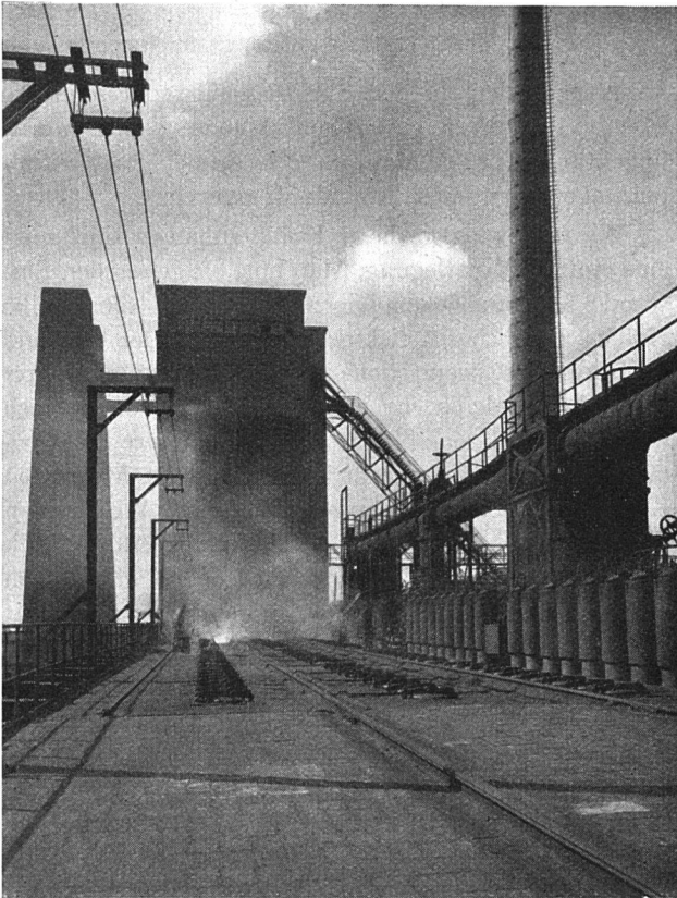
Auf der Ofenkammer des Gaswerkes Zürich

worden, der erfinderische Geist des Menschen hat einen Weg entdeckt, den Ersatz, vielleicht sogar mit noch vollkommeneren Eigenschaften, doch schließlich zu beschaffen. Man denke an die Farbstoffe, an Gummi, an Textilstoffe und anderes mehr. Vorläufig aber muß die Kohle in mancherlei Hinsicht gleichwohl noch als unersetzlich bezeichnet werden.