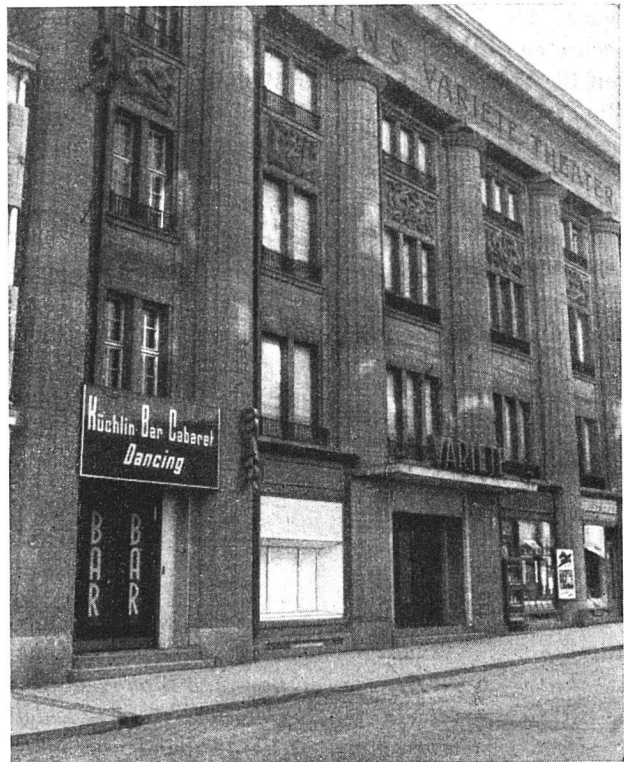
— und der Ort des Vergnügens