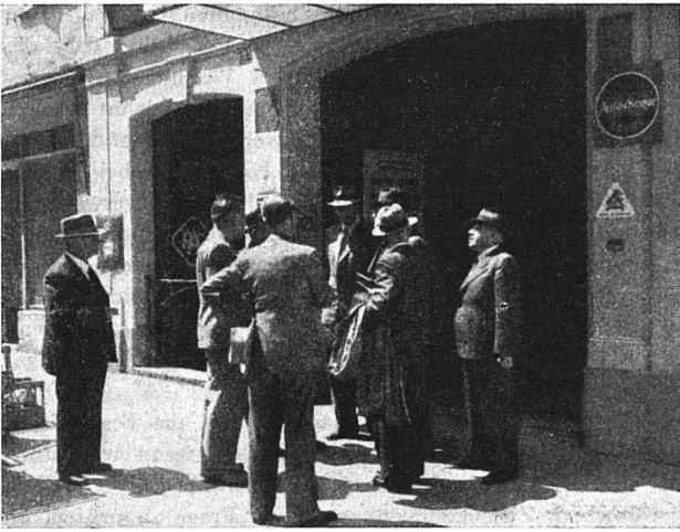
«Die Diskussion wird fortgesetzt»