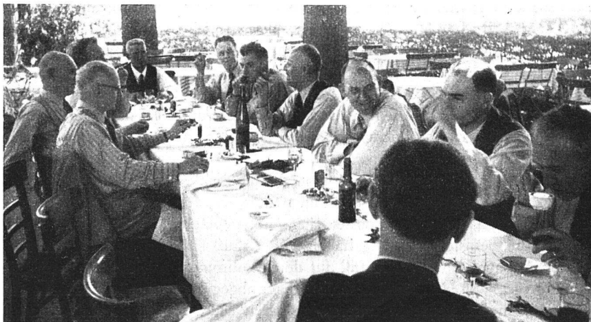
Vor dem Kampf — ein Augenblick «Solitude» im Zentralvorstand