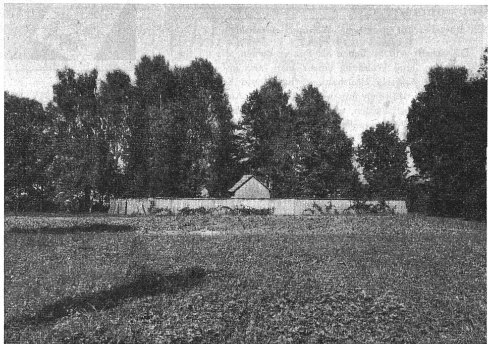
Greifensee Idylle von hinten: Wochenendhaus umgeben von hohem Bretterzaun