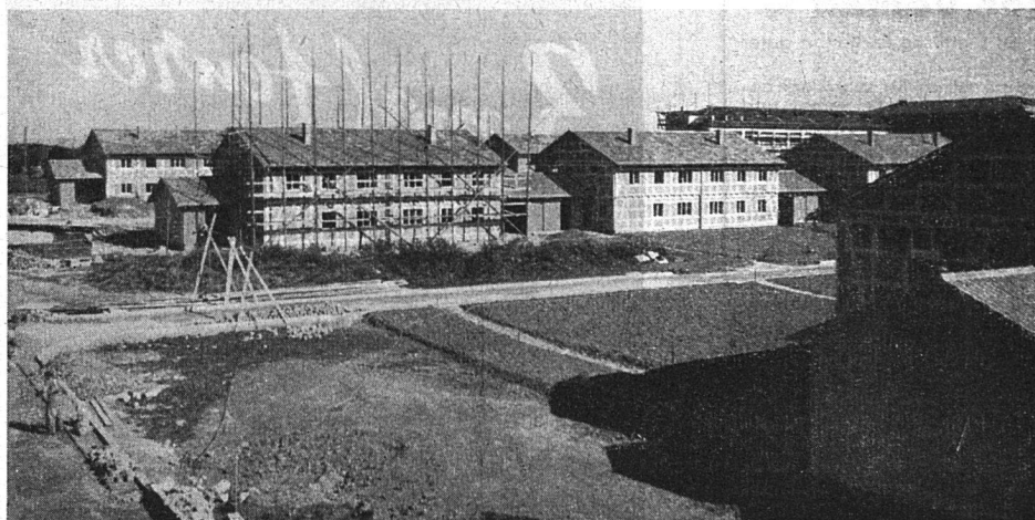
Einfamilien-Riegelhäuser der Gemeinnützigen Baugenossenschaft Glattal an der Wallisellen-Saatenstraße in Zürich

Die Küche ist mit elektrischem Herd mit drei Kochstellen und Backofen — mit einem 30-Liter-Warmwasserboiler —, ferner mit Steinzeugschüttstein und Küchenschrank ausgestattet. Die Waschküche enthält den Waschtrog und Waschherd für Holz- und Kohlenfeuerung; daran angeschlossen ist die Badewanne.