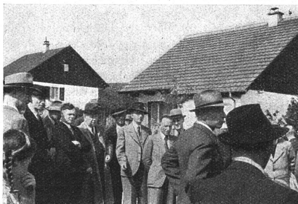
Die Kleinsiedlungen im «Löchligut» begegnen ausgesprochenem Interesse