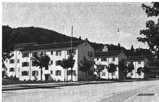
I. Bauetappe Ansicht von der Überlandstrasse

cher Bauten soll aber zugleich auch eine glückliche Basis geschaffen werden, von wo aus der Gedanke wahren genossenschaftlichen Handelns und Strebens verwirklicht und beseelt werden kann.