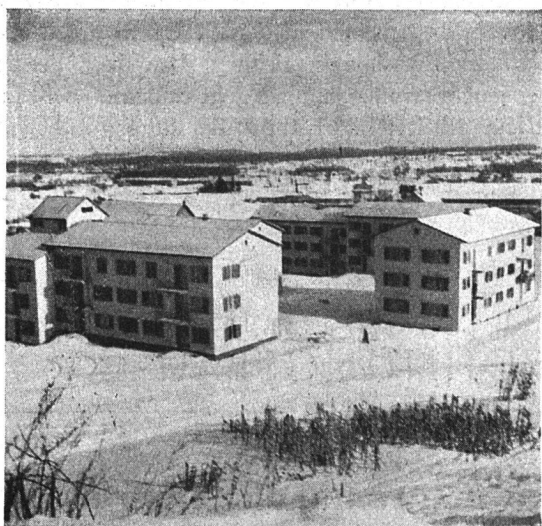
I. Bauetappe Ansicht von der Schwamendingenstrasse