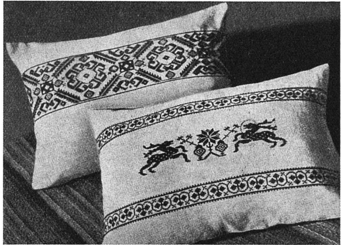
Kissen mit Kreuzstichbordüre. Ein Kissen soll die Wohncke beleben, aber es darf nie unruhig wirken und nicht auffallen. Es wird deshalb nur in einer Farbe bestickt.

Kaum ein anderer Zweig weiblichen Kunstfleißes hat jedoch im Laufe der letzten Jahrzehnte einen so erschreckenden Niedergang genommen, wie gerade die Kreuzstichstickerei. Den Tiefpunkt erreichte diese Entwicklung wohl mit den aufgepausten ausländischen