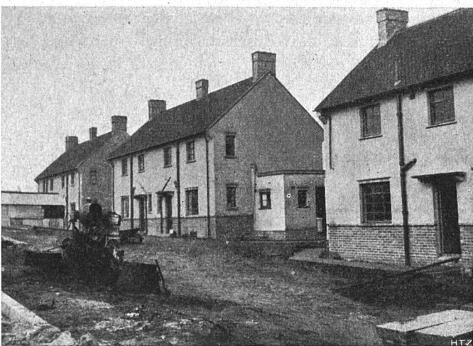
Abb. 5. Unansehnliche Neusiedlung mit außerhalb der Häuser angeordneten Ablaufleitungen