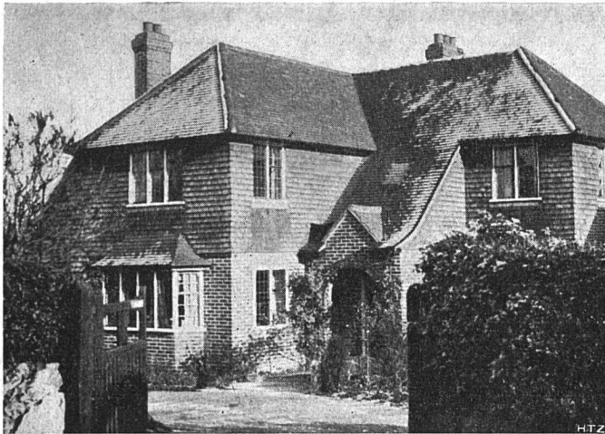
Abb. 1. Neuere Einfamilienhaus