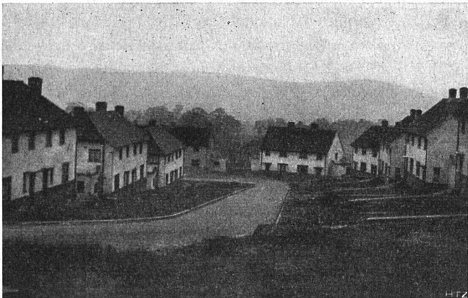
Abb. 3. Moderne Wohnhaussiedlung an Betonstraße