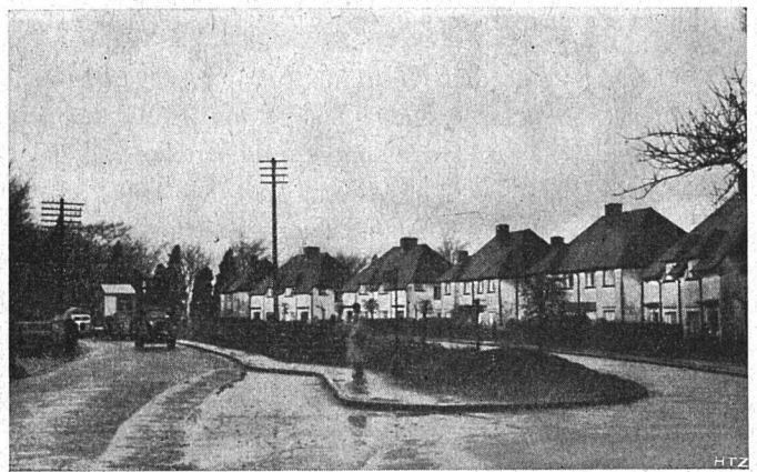
Abb. 4. Neusiedlung an einer Nebenstraße; von der Hauptverkehrsstraße abgerückt