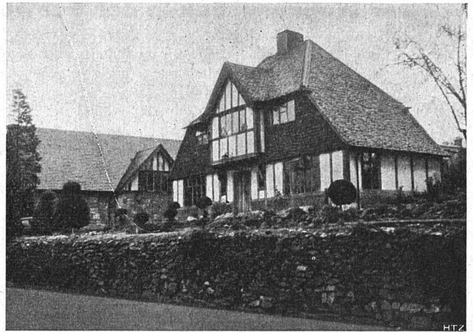
Abb. 2. Älteres Einfamilienhaus